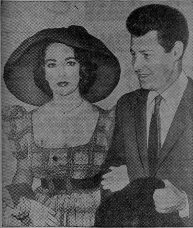
PAREJAS ROMANTICAS: Eddie Fisher y Elizabeth Taylor, en su luna de miel, caminan de brazos en Nueva York, antes de partir para España. Allí se encontrarán con un yate que los llevará en un crucero privado. (Arriba), otra pareja de cinecanción se divierte en Cannes, Francia. Son Cary Grant y Kim Novak que estuvieron bailando hasta al amanecer en la fiesta que dió la delegación rusa en Cannes