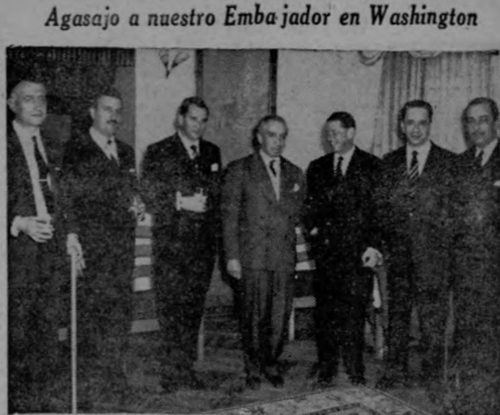
Agasajo a nuestro Embajador en Washington

Esperan ambas Comisiones cumplir con todo éxito estas funciones.