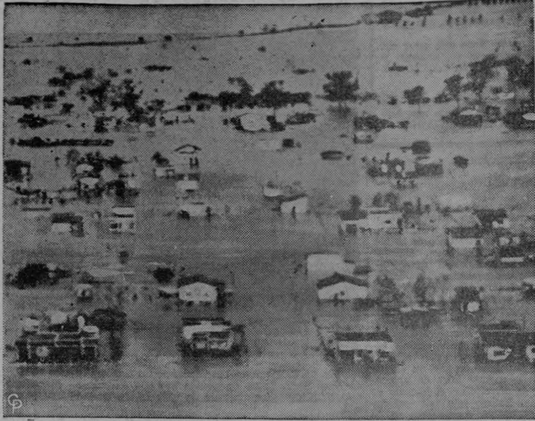
17 MUEREN EN INUNDACIONES EN SUDAMERICA: Las casas en el suburbio de San Fernando de Buenos Aires quedaron completamente aisladas por las inundaciones. La Argentina se ha negado a recibir ayuda de los Estados Unidos por las peores inundaciones sufridas en la historia de Sudamerica, donde han muerto por lo menos 17 personas, lesionadas veintenas y han dejado a más de 300.000 sin hogar. Gran número de regiones en Bolivia, Brasil, Paraguay y Uruguay, también han sufrido por las inundaciones.

Los insurrectos lanzaron ataques y arrojaron granadas en puntos de Argelia distantes entre sí para tratar de atemorizar a los musulmanes y mantenerlos alejados de los comicios. No obstante, sólo dos personas murieron y cuatro resultaron heridas en todo el territorio.