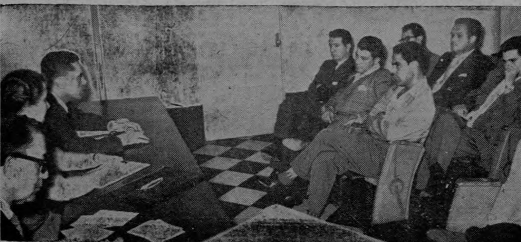
Un aspecto de los asistentes a la reunión de esta mañana en Salubridad Pública en que se sentaron las bases de un proyecto para impulsar las huertas escolares

Representantes de las N. U. y personeros del Gbno. se entrevistaron en el Ministerio de Salubridad.— Sentadas bases para impulsar huertas escolares.