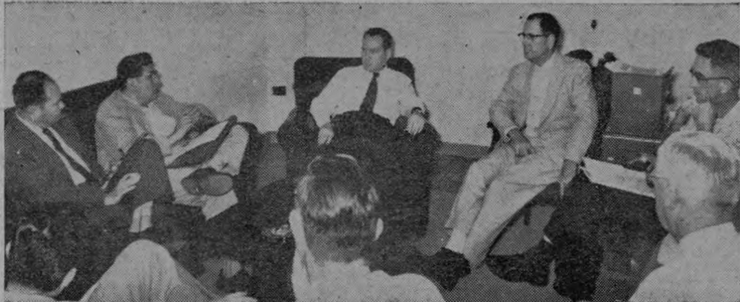
Recoge la foto un aspecto de los asistentes a la reunión de esta mañana en que se acordó la distribución de cinco millones de colones para mejoramiento de la industria cacaotera.—

POR "ORDEN SUPERIOR" Pasa a la Pág. OCHO