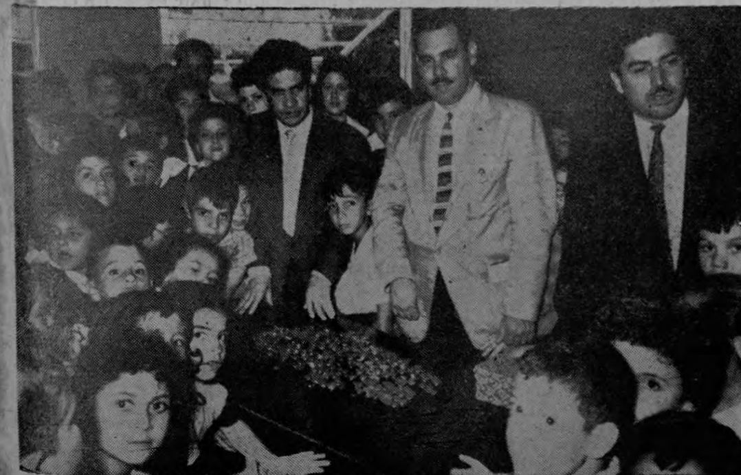
En la gráfica se observa el momento cuando el Presidente del Club de Leones se dispuso a tomar el dinero que servirá para construir el Hogar de Rehabilitación de los Poliomielíticos.

"En la prestigiosa columna de su diario, Temas del Momento, de la edición de ayer, Pasa a la Pág. SIETE