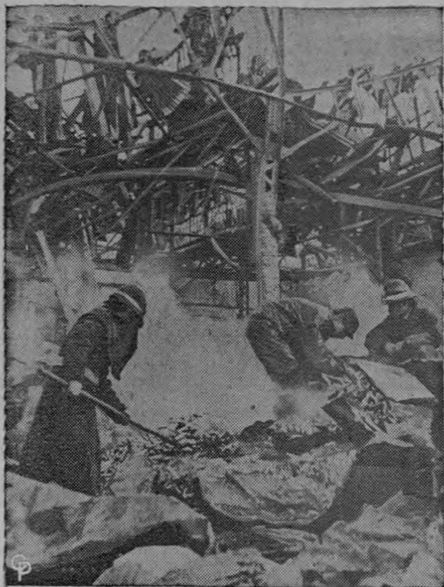
BUSCAN LA CAUSA DE LA EXPLOSION. —Los bomberos escudriñan las ruinas de una planta de productos químicos en Opana, Japón, después de una violenta explosión que mató a tres personas y dejó heridas a 381. Por lo menos 20 de los heridos se encuentran en críticas condiciones. No se dió ninguna explicación acerca de la explosión en la planta, la cual produce explosivos para uso industrial y municiones para la defensa de Japón.