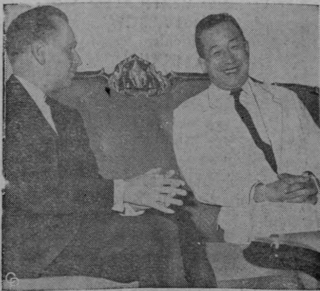
SECRETARIO DE LA ONU EN LAOS. — El Rey de Laos, Savang Vatthana (derecha), conferencia con Dag Hammarskjöld, Secretario General de las Naciones Unidas, durante la visita de este último a la residencia real del monarca, en Vientiane. El líder de las Naciones Unidas se encontraba en un recorrido por varios paises, incluso Japón