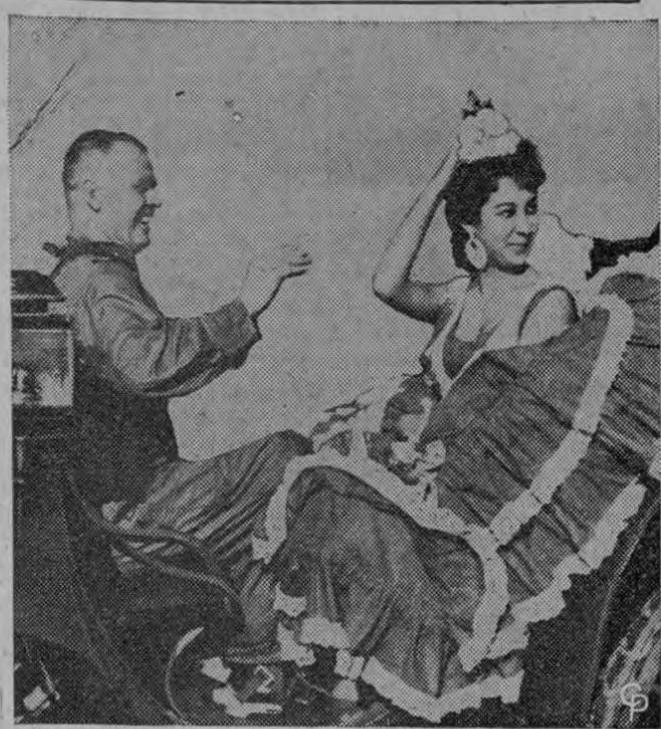
BIENVENIDA EN ESPAÑA.—El Coronel George Ruddell viaja en un carruaje desde el aeropuerto de Sevilla, España, acompañado de una jovial señorita, quien le dio la bienvenida al primer vuelo trasatlántico de los Starfighters F-104. Ruddell fue el comandante del vuelo de los 18 aviones que se reabastecieron de gasolina en Bermuda y las Azores, antes de llegar a España. El escuadrón de jets supersónicos será estacionado en ese país.

Gómez Jaramillo es optimista por esta nueva empresa de los cafetaleros de Colombia, sin que desconozca las dificultades que ella ofrece y el largo proceso que requiere para su debida aclimatación.