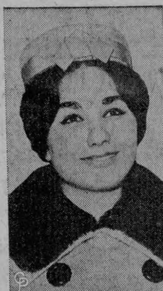
BODA A LA VISTA.—Farah Diba, de 21 años, regresa a Teherán, Irán, después de haber llevado 51 maletas con modas parisinas para su boda con el Sha Mohammed Rizo Pahlevi, de 40 años. Diba, nativa de Irán que estudió arquitectura en Francia, será la tercera esposa del Sha. Las dos primeras esposas del Sha no le dieron a éste un hijo varón, motivo por el cual se divorció de ellas.

tados comerciales, a base de trueque de café y banano por maquinaria agrícola e industrial, mecánica, automotriz, aparatos de precisión. Es posible que también se estudie la posibilidad de trueque de algodón, artículo que ya ha comenzado a exportar Colombia. La misión después de su visita a Bogotá anunció que visitaría las principales ciudades del país como Cali, Manizales, Medellín y Barranquilla antes de regresar al Japón, con el objeto de establecer contacto con los círculos económicos.