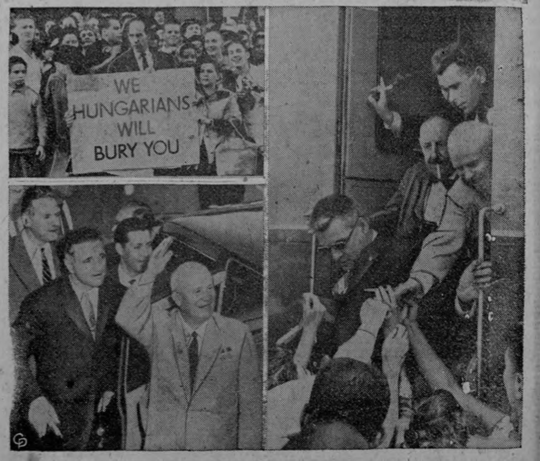
SALUDANDO AL PUEBLO.—El Premier soviético Nikita Krushchev se inclina para estrecharle la mano a un grupo de amistosos curiosos (der echa) en San Luis Obispo, Calif., ignorando los esfuerzos de los guardaespaldas, que tratan de apartar al público. Krushchev se dirigía a San Francisco, donde fue recibido por el Alcalde George Christopher (abajo, izquierda), y se le dispuso una calorosa bienvenida. Detrás de ellos aparece el Embajador Henry Cabot Lodge, quien acompañó al líder ruso. Krushchev dijo que "la mayoría de los que lo recibieron estaban felices", agregando que siempre tenía que haber "un tanto", mientras señalaba a un hombre que cargaba un cartel de protesta (arriba).