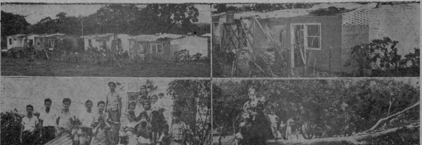
Recogen las gráficas: 1º Las seis casas que quedaron semi-destruidas a consecuencia del tornado; una de las residencias tal y como quedó luego de recibir el impacto del huracán.

A las 4.30 de la tarde Serfan aproximadamente las Pasa a la Pág. CINCO