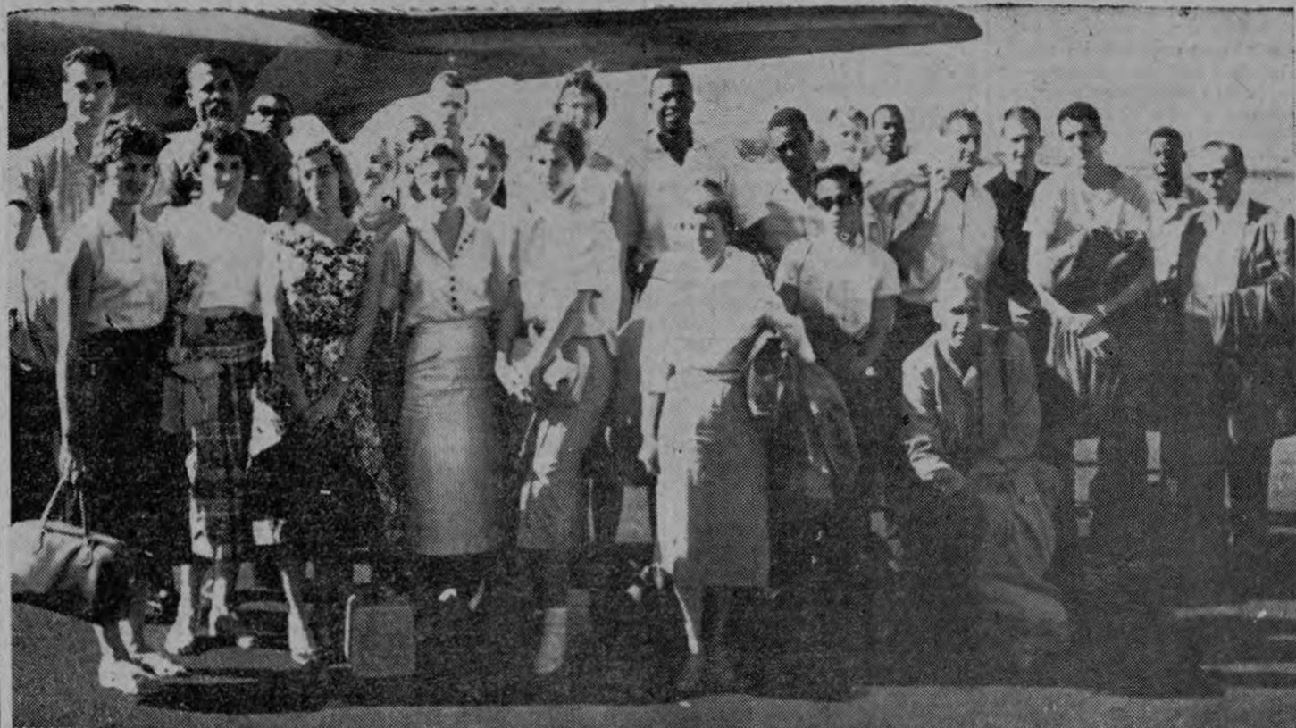
En esta espléndida foto de Arévalo se ve al grupo integrante de la misión deportiva de los Globe-Trotter de Harlem. Los famosos atletas que debutarán esta noche en el Estadio Nacional. Los Tro tamundos de Harlem, uno de los espectáculos más notables de su género, están, ya entre nosotros

Hoy a las 7:30 p. m., harán su primera presentación en el Estadio Nacional, los mundiales famosos "Trotamundos de Harlem". Nuestros aficionados aún recuerdan las apreturas y apuros que tuvieron que sufrir para