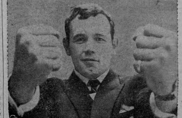
El bateador Ted Williams (arriba derecha) firmó con los Red Sox por más de $125.000 para la temporada de 1959. Arriba, izquierda, Bill Russell, de los Celtics de Boston, equipo profesional de basquet después de recibir la Copa Presidente tras el Juego de Estrellas. Abajo, Ingemar Johansson, campeón europeo e invitado boxeador de peso completo de Suecia llega a Nueva York. Dijo que está dispuesto a pelear con el campeón mundial Floyd Patterson por el título en el mes de junio, en Nueva York, Los Angeles, o Colorado Springs Colorado