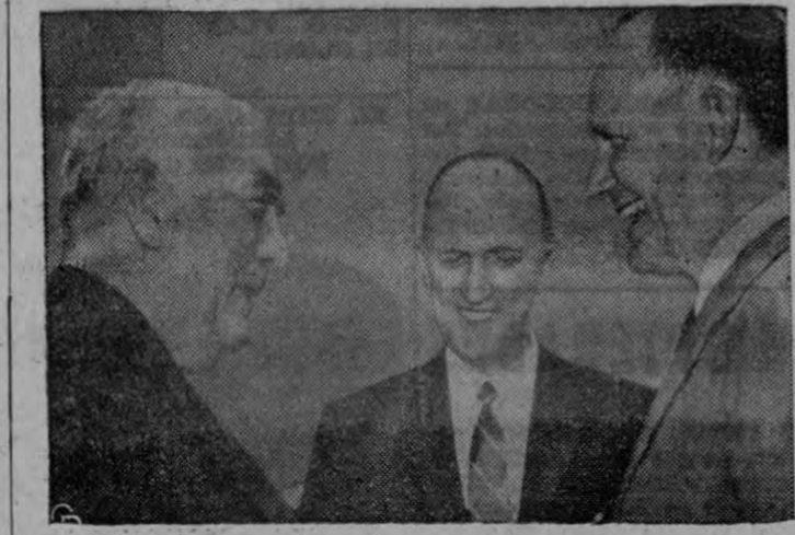
VISITANTE DE AUSTRALIA.—El Primer Ministro de Australia Robert G. Menzies (izquierda), recibe la bienvenida del Secretario de Estado interino C. Douglas Dillon (derecha), a su llegada a Washington. Al centro el Embajador de Australia Howard Beale. Menzies vino a los Estados Unidos para discutir problemas mundiales con el Presidente Eisenhower y el vicepresidente Nixon.