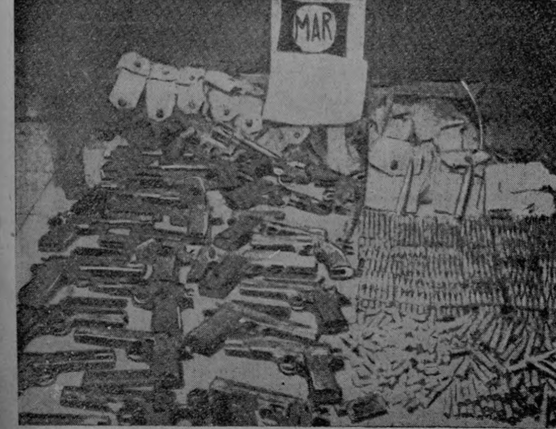
En esta foto podemos apreciar las armas que fueron halladas por la Guardia Nacional Panameña, enterradas en la playa de Santa Clara. Es el segundo hallazgo de armamentos que hace la Guardia Nacional en las proximidades del sitio donde desembarcaron el Dr. Roberto Arias y un grupo de amigos