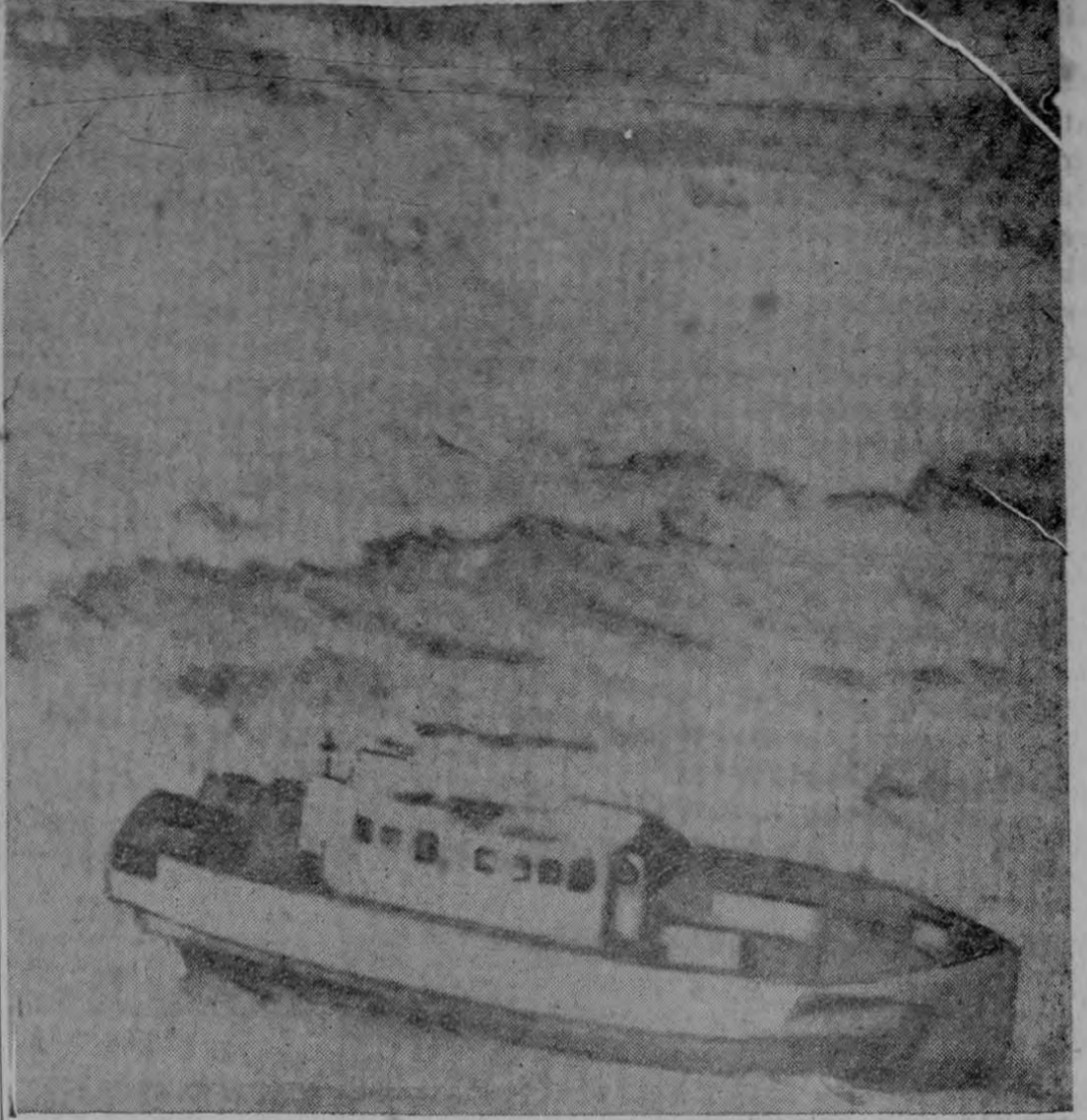
Presentamos aquí una vista tomada desde el aire a la lancha pesquera Mayare que el día sábado de la semana pasada encalló en las playas de la Bahía Mandinga. Posee dos motores de ciento veinticinco caballos de fuerza cada uno, la misma que fue obtenida por compra en Cuba a un señor de apellido García, y la que se usó —según se dijo— para realizar un desembarco de rebeldes en Panamá

Cuba dió hoy su pleno respaldo a la intervención de la Organización de los Estados Americanos en ayuda de Panamá contra el ataque de un grupo de invasores, en su mayoría ciudadanos cubanos.