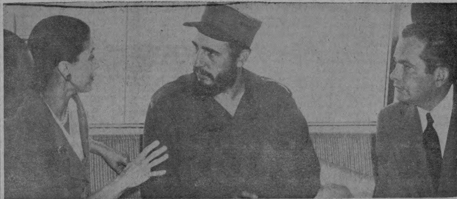
TRES REVOLUCIONARIOS REUNIDOS.—En esta gráfica exclusiva de LA PRENSA LIBRE, aparecen Fidel Castro, Roberto Arias (calificado como jefe del movimiento revolucionario de Panamá) y la bailarina inglesa Margot Fonteyn, esposa de Arias, reunidos en "algún lugar" poco tiempo antes de que estallara el movimiento armado de Panamá.—