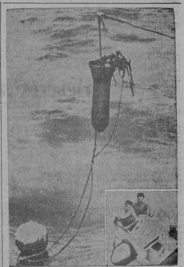
RECUPERAN COMO EN EL ATLANTICO.—El cono de un proyectil Thor-Able es montado a bordo del barco de la fuerza aérea Coastal Crusader, cerca de la isla de la Ascensión. A la izquierda, está el saco de flotación que impidió que el cono se hundiera en el Atlántico del Sur, a 5,000 millas de su lanzamiento en Cabo Cañaveral, Florida. Insertado aparecen algunos marinos con el precioso cono, que es el primero de los proyectiles Thor-Able recuperado, y que será estudiado para ver los efectos de la re-entrada en la atmósfera de la Tierra.