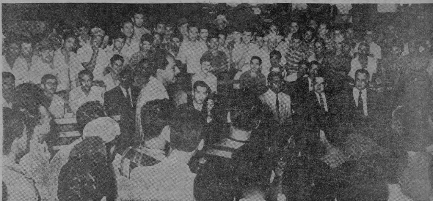
Esta foto de Artavia ofrece el momento en que se realizaba una reunión de trabajadores del MOP en los talleres del propio Ministerio con asistencia de los diputados Monge Al-

verificarse esta mañana en los talleres de Obras Públicas. De los diputados invitados a esa reunión, concurrieron sólo los — Pasa a la Pág. NUEVE