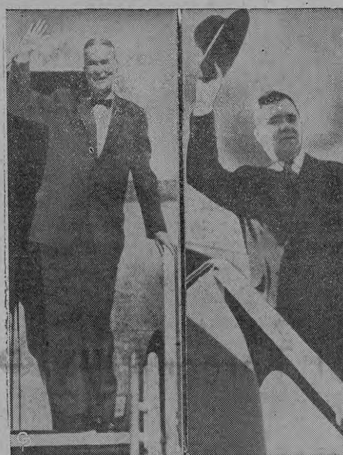
MISION CUMPLIDA. — El Secretario de Estado, Christian A. Herter (Izquierda) y el Ministro de Relaciones Exteriores de Rusia, Andrei A. Gromyko (derecha), dicen adiós mientras abandonan Ginebra, Suiza, rumbo a sus países, después de haber terminado la conferencia de Ministros. Aunque no se llegó a un acuerdo acerca de la unidad de Alemania Occidental, Herter dijo que estaba convencido de que las negociaciones habían salvado al Berlín Occidental de cualquier inmediata amenaza comunista. Gromyko dijo "un útil y considerable trabajo" fue realizado en las sesiones.