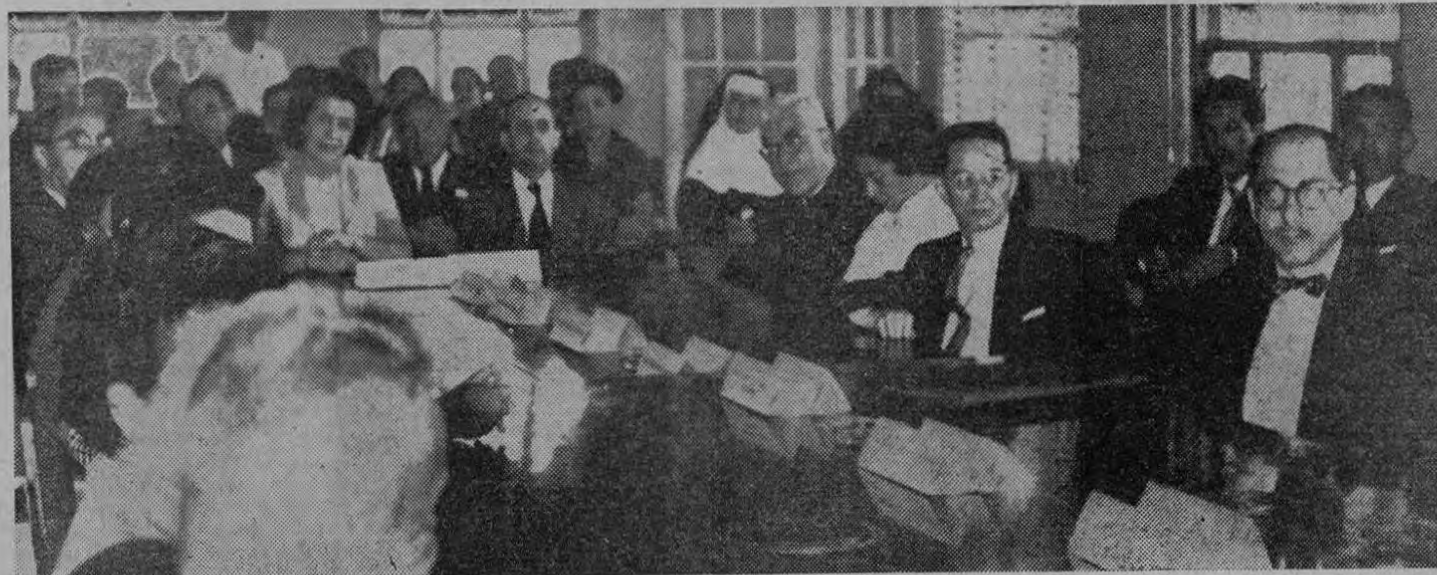
La gráfica recoge un aspecto del acto inaugural de la Conferencia de los Grupos que estudian los problemas del Desarrollo de la Comunidad en Costa Rica. En la fotografía aparecen los asesores que las Naciones Unidas a través del CREFAL