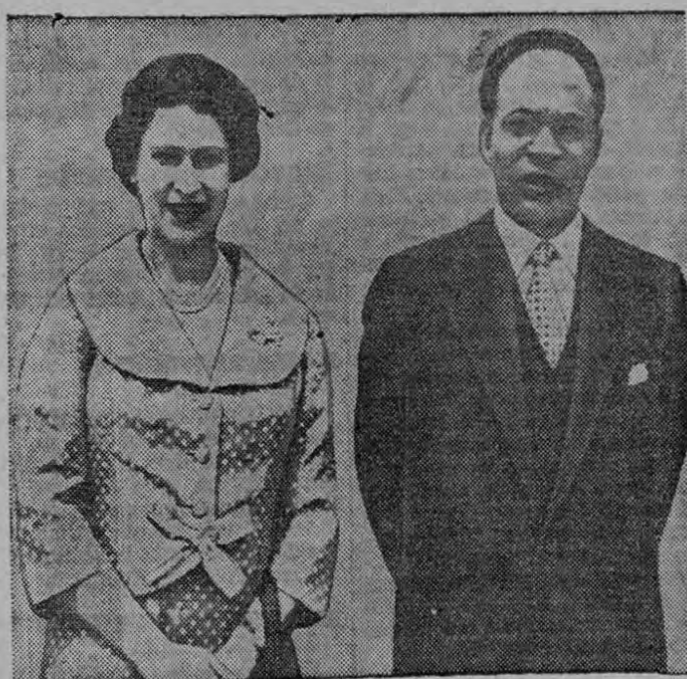
LA REINA Y EL PRIMER MINISTRO DE GHANA. La Reina Isabel II de la Gran Bretaña, recibe al Primer Ministro de Ghana Kwame Nkrumah, en el Balmoral Castle, Escocia, donde éste fue hecho miembro del Consejo Privado (Privy Council). El Dr. Nkrumah, de 49 años, encarcelado por los británicos por sedición hace 9 años, es el primer africano en ser miembro del Consejo. La Reina le dijo al Primer Ministro que lamentaba tener que cancelar su visita a Ghana debido a que se encontraba en estado de gestación.

MINISTERIO DE SALUBRIDAD PUBLICA Departamento de Educación Sanitaria.