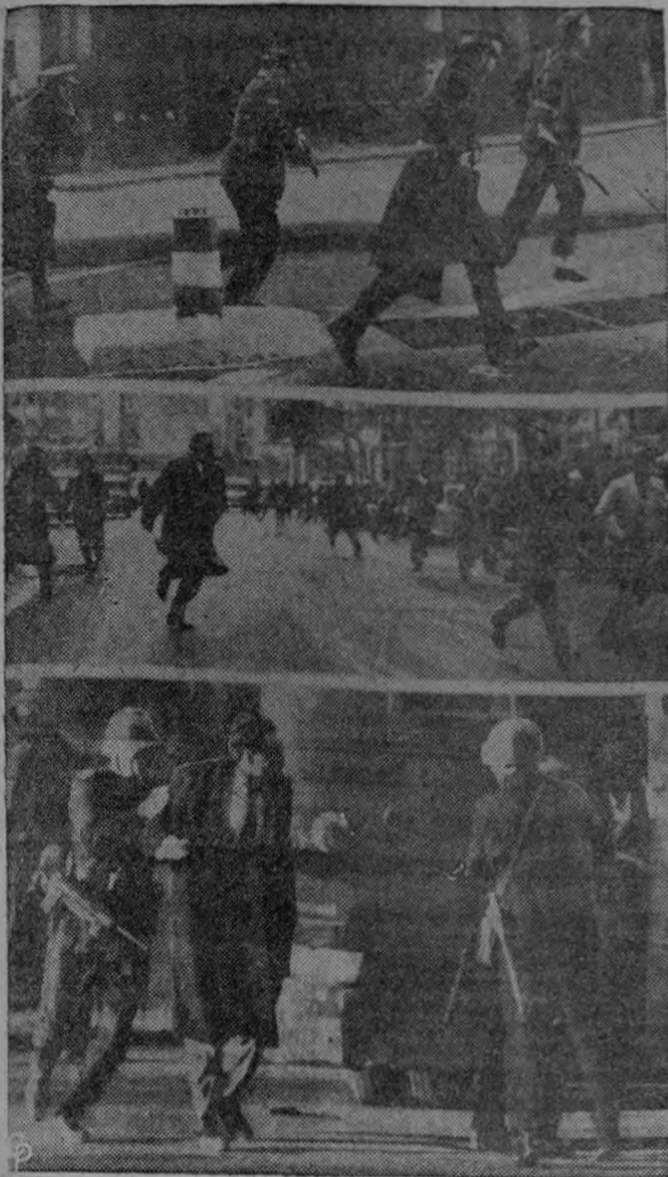
DESORDENES EN LA ARGENTINA.—La policía (arriba) corre por las calles de Buenos Aires con gas lacrimógeno y rifles para desbaratar una violenta demostración de los empleados bancarios. Al centro, los huelguistas huyen después de los disturbios, que duraron cuatro horas. Al fondo, alrededor de 100 personas fueron detenidas y enviadas en autos jaulas a la cárcel.