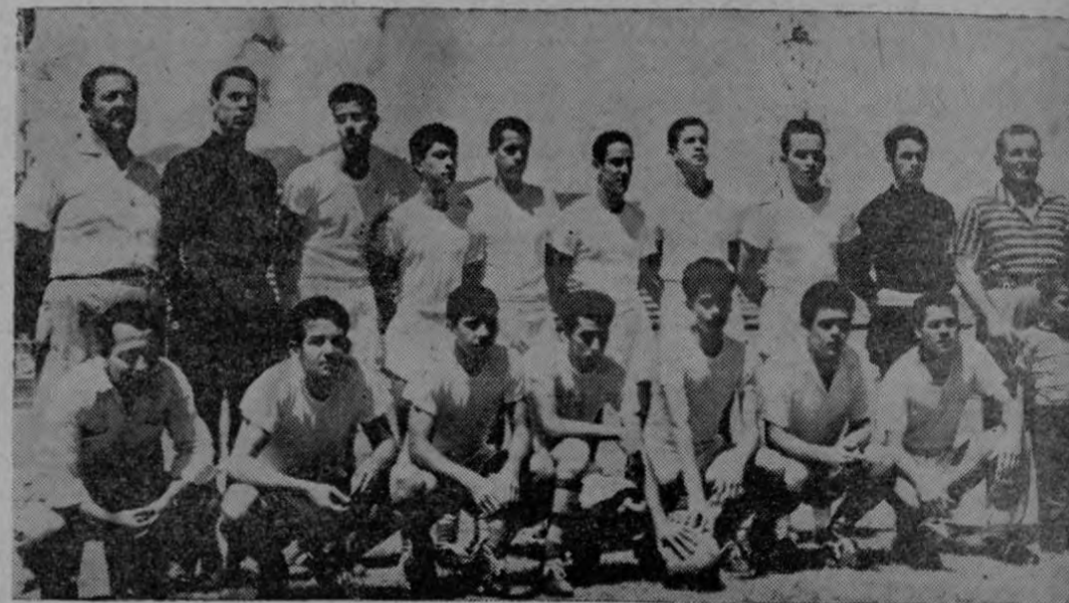
Equipo del Liceo de Heredia, que obtuvo el sub-Campeonato en el torneo Intercolegial que acaba de finalizar, disputándose el liderato con el equipo del Liceo de Costa Rica.