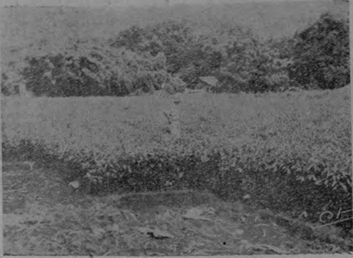
Almacigo de café producido con semillas del Proyecto Cooperativo que llevan a cabo el MAI y el Consejo Nacional de Producción. El rendimiento por área sembrada aumenta notablemente mediante la utilización del "manquito" y la semilla seleccionada que se obtienen por medio de dicho proyecto.