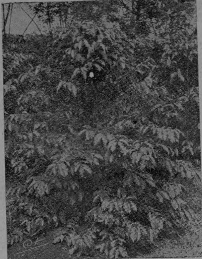
Planta de la variedad Hibrido (hibrido nacional), obtenida a través del Proyecto Cooperativo de Semillas del MAI y el Consejo. Nótese la enorme cantidad de fruta.

Con el fin de aumentar la producción de café por área sembrada y disminuir así los costos de la principal industria nacional, el Consejo Nacional de Producción y el Ministerio de Agricultura han estado trabajando desde el año 1950 en la obtención de semilla seleccionada de la valiosa planta. Agrónomos y botánicos especializados trabajan intensamente en la selección y asistencia técnica de las mejores plantas y la recolecta de los granos de mayor poder germinativo y más alta capacidad de producción. Después de un largo proceso la semilla es vendida a los caficultores a precios muy favorables, favoreciéndose así en forma notable la industria de mayor importancia en la economía nacional.