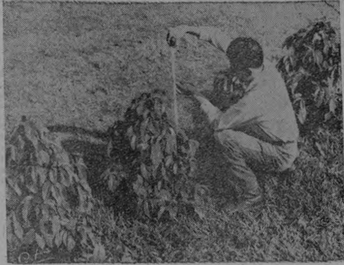
Agrónomo del Proyecto verifica el crecimiento de las plantas como parte de la labor de selección de los mejores ejemplares que servirán para obtener las semillas.

Con el fin de aumentar la producción de café por área sembrada y disminuir así los costos de la principal industria nacional, el Consejo Nacional de Producción y el Ministerio de Agricultura han estado trabajando desde el año 1950 en la obtención de semilla seleccionada de la valiosa planta. Agrónomos y botánicos especializados trabajan intensamente en la selección y asistencia técnica de las mejores plantas y la recolecta de los granos de mayor poder germinativo y más alta capacidad de producción. Después de un largo proceso la semilla es vendida a los caficultores a precios muy favorables, favoreciéndose así en forma notable la industria de mayor importancia en la economía nacional.