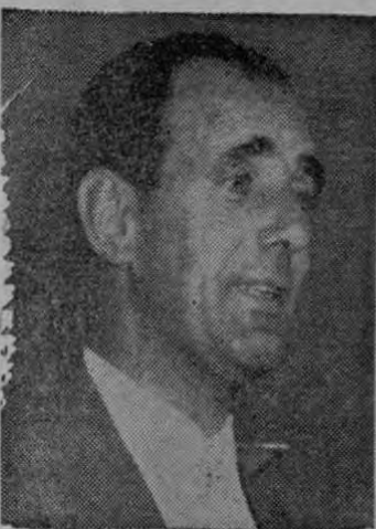
—Qué hay recién llegado? —Pues eso, que acabo de llegar y tengo muchas cosas que hacer.

En ningún momento se me ha faltado al respeto.— No puedo ser más extenso; la Federación tiene la palabra.— Los mexicanos no son tan buenos como ellos creen, ni tan malos como se cree aquí.— Tengo confianza en que el próximo domingo, nuestros muchachos sabrán sacarse la espina.—