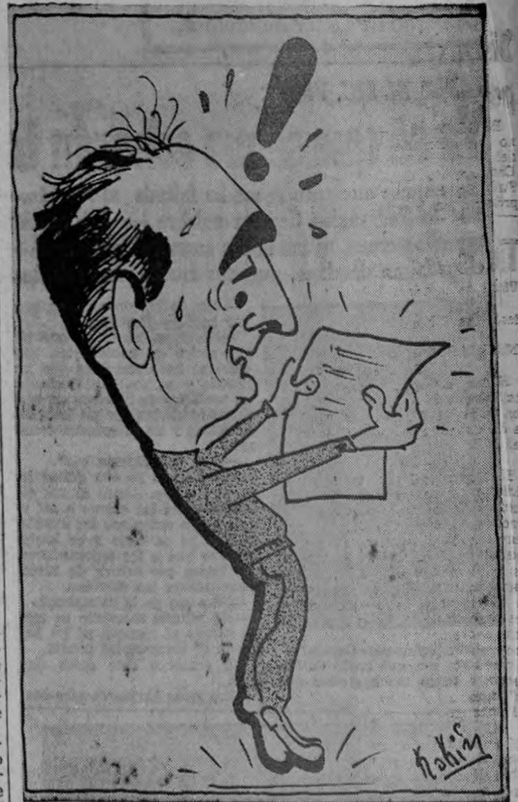
AVISO: — Avise si avisamos a España que esperen aviso. — LA AFICION.