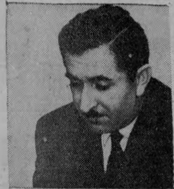
DICE QUE ES NEUTRAL.—El Primer Ministro del Líbano, Rashid Karami, de 37 años, le dice a los periodistas en Nueva York que la política de su nación es "positivamente neutral"