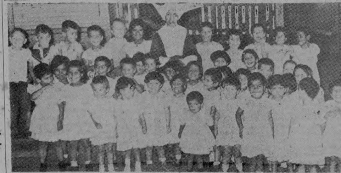
En el Asilo de Huérfanos, en la mañana de hoy tomamos estas dos gráficas: la cantidad de comestibles llegados a ese Asilo, luego de que LA PRENSA LIBRE empezó a circular ayer. En la otra, un grupo de huérfanos, con la