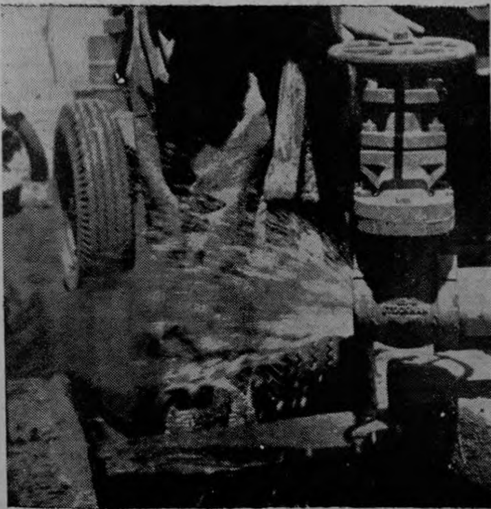
Nótese el "chorro" de agua que saltó. Luego de una perforación de 15 días, en el patio de la lavandería del Hospital del Seguro Social, el Policlínico. Este líquido salvará a ese Hospital de la angustiada escasez que venía sufriendo

El consorcio, según se nos dijo, comprará la fruta a los agricultores para colocarla en los mercados mundiales. Supimos que todavía se está en conversaciones para llevar a cabo este proyecto que, como puede observarse, es de gran importancia para el desarrollo económico de la región atlántica.