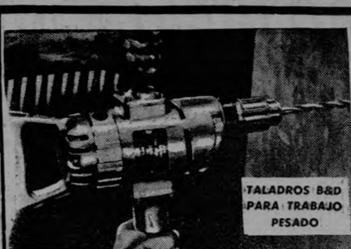
TALADROS B&D PARA TRABAJO PESADO

Ahora bien, cabe preguntarnos, y si expresamente se excluyeron de la disposición dictada a las Juntas de Protección y a los hospitales, por qué esos organismos están realizando una campaña en el sentido de que se trata de intervenir en su organización interna? La respuesta es clara, porque no hay lealtad de parte de ellos en el planteamiento de la polémica, porque procuran engañar a la opinión pública, porque creen de su conveniencia plantear la tesis sobre premisas falsas y todo, es lo lamentable, movido por debajo por los tres o cuatro interesados que ganan fabulosos sueldos y que, a pesar de ello, casi ni asisten a sus oficinas, como será fácilmente demostrable.