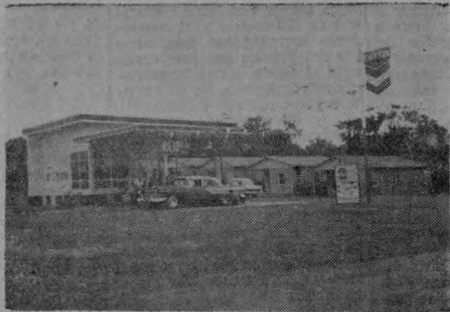
San Ramón Servicio CHEVRON