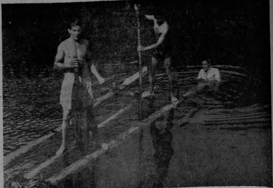
Dos porteadores de la expedición ayudan al autor de estos apuntes en sus sondeos en la Laguna de Don Beto. La almadía fue construida con troncos de balsa y bejucos de las cercanías. En esta laguna se supone existió un cráter parásito del Arenal

A los 1.350 metros la vía queda cortada por un desprendimiento terrible de una pared del cerro y 15 metros más arriba se localiza el primer acumalamiento volcánico formal. En este lugar hay unas hondanadas que presentan condiciones similares a las fumarolas de la cima y posiblemente hayan tenido emanaciones de gases o vapor en épocas no muy lejanas. De aquí hasta los 1475 metros no se encuentran más cúmulos volcánicos y de esa altura en adelante se suceden por docenas, delante de paredes perpendiculares totalmente llenas de arena. También de aquí en adelante se entra a la llamada "Región de las Lanás E-