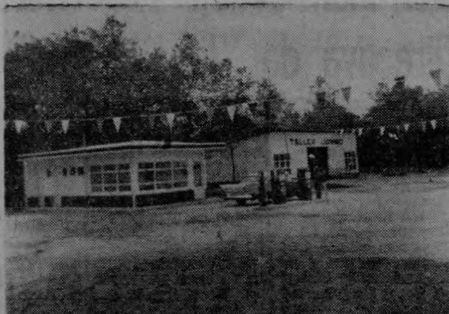
Liberia Servicio CHEVRON