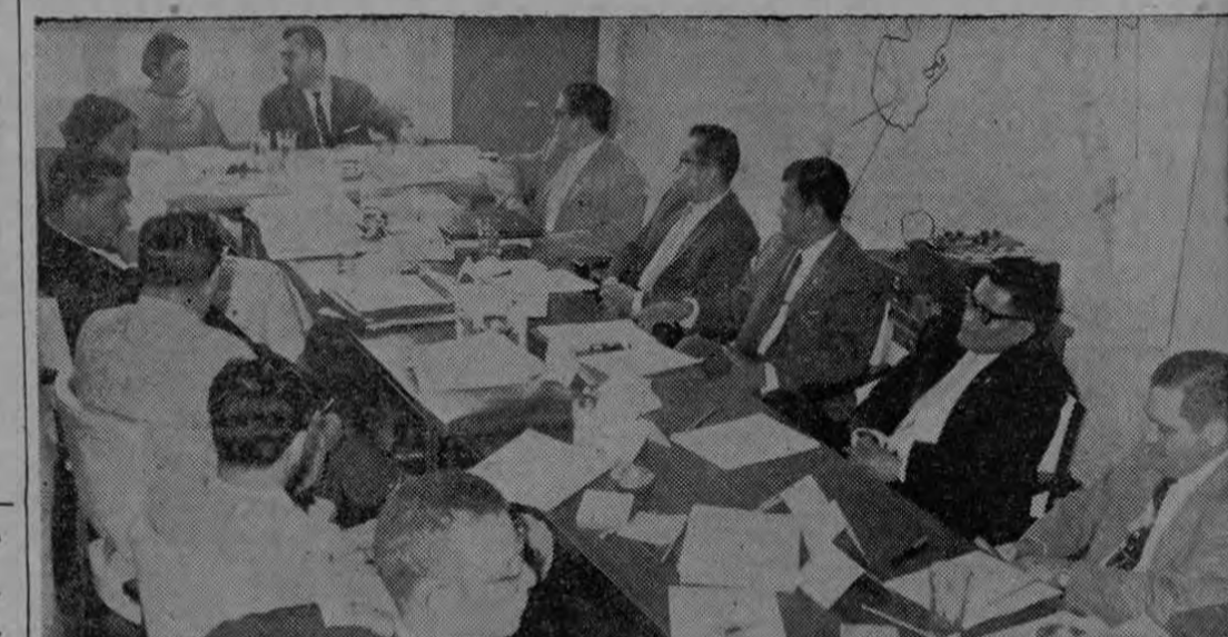
Muestra la gráfica de Roa un aspecto general de una de las reuniones del Seminario sobre Administración Censal que está realizándose en la ESAPAC, con la asistencia de altos funcionarios centroamericanos y de Naciones Unidas y otros organismos internacionales

La Junta General de la Escuela Superior de Administración Pública América Central y la Dirección de la misma, considerando la enorme importancia que tendrá el Censo General de 1960 para los planes de integración centroamericana, dieron a las Naciones Unidas toda su cooperación para la realización de un Seminario sobre Administración Censal.