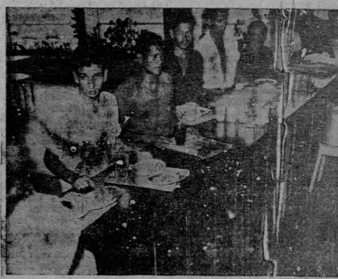
Llevando bandeja, cada uno de los empleados elige a la hora del almuerzo sus platos y bebidas preferidas en el extenso comedor de la Republic Tobacco Co.