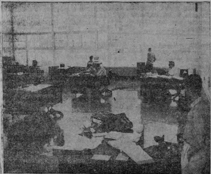
Las oficinas centrales no desmerecen a la par de las modernas instalaciones de los grandes países.

Los altos personeros de la "Republic Tobacco Co." ofrecieron una hermosa recepción a la prensa, en las personas de sus directores, ayer a las diez horas, con motivo de la inauguración de sus nuevas y modernas plantas, ubicadas a solo diez minutos del centro de la capital, en la carretera que conduce a El Zapote.