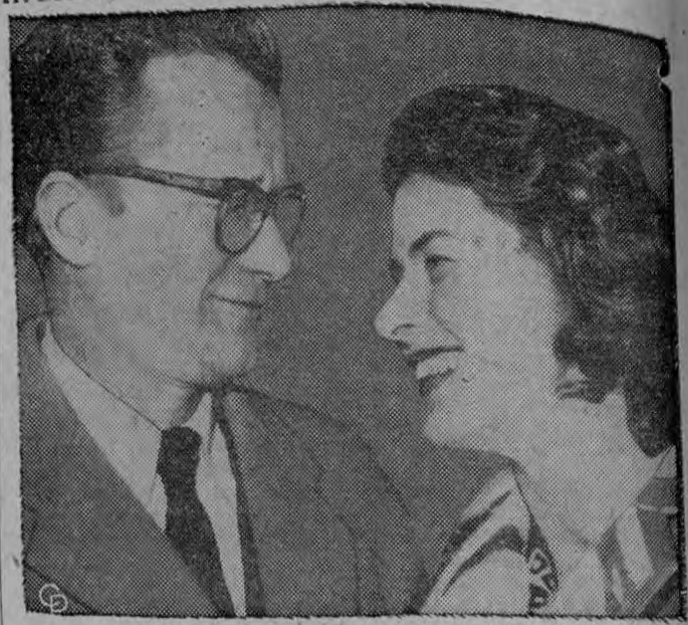
La actriz Ingrid Bergman, de 43 años, y el millonario sueco Lars Schmidt, de 41, se miran al recibir a la prensa a la entrada de su villa en Choisel, a 56 kilómetros al suroeste de París. Se casaron secretamente en Caxton Hall, Inglaterra