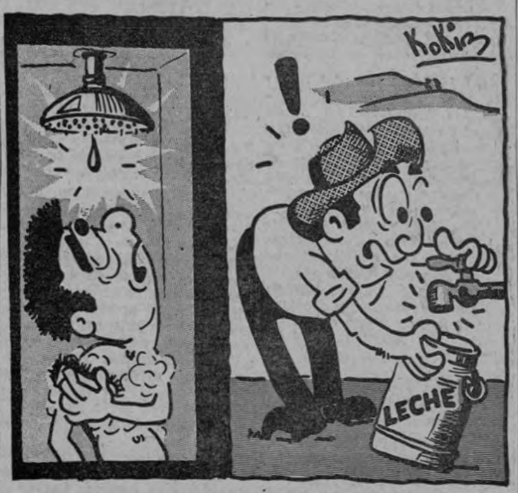
NI PARA LA LECHE!!

Nueva política de sanidad anuncia el Ministro El Ministerio de Salubridad Pública anunció esta mañana que comenzará a ejecutar el plan sanitario especial a partir del 28 de enero en curso. El plan —que ya había sido anunciado con antelación por LA PRENSA LIBRE—, consiste en la intensificación de los programas de construcción de unidades sanitarias y centros rurales de asistencia médico-social. La arrancada del mismo se hará en San Isidro de El Pasa a la Pág. TRES