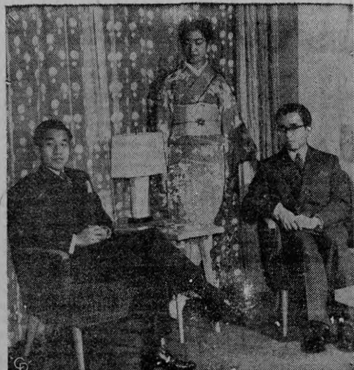
Los saludos de año nuevo del Japon se unen a la publicación de esta fotografía tradicional de los hijos del Emperador Hirohito. (De izquierda a derecha) el Príncipe heredero Akihito, la Princesa Suga, y el Príncipe Yoshi