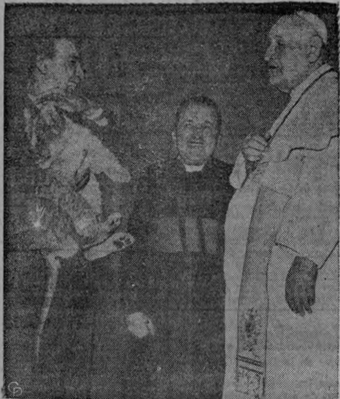
El Papa Juan XXIII conoce a Dolly un cachorro de león de 45 días durante una audiencia en-masa en Ciudad Vaticano a los miembros del Circo Orfei