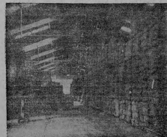
Una sección de las grandes bodegas, en donde se guardan cuidadosamente empacados los magníficos tabacos que se producen en el país.