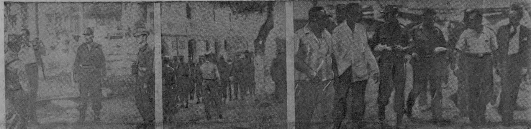
Las presentes fotografías fueron tomadas minutos después de que las patrullas de la Guardia Nacional de Panamá llegaron a Santa Fe para iniciar la persecución de los revolucionarios de Veraguas y de Pico Banquillo. A un lado el Capitán Torrijos imparte instrucciones a los G. N. y al otro los comandos debidamente armados instantes antes de salir en su misión. En la otra foto se recoge la llegada de Torrijos herido a Ciudad de Panamá. Lleva el brazo vendado. En la parte final del mapa indica la zona de Veraguas donde la revolución se ha iniciado. Los puntos de vigilancia son: Río Santa María, Las Tablas, Santiago, Golfo de Montijo, Isla Cebacos, y otros.