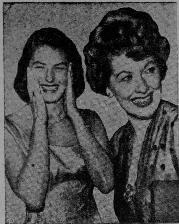
CALUROSA BIENVENIDA A INGRID. —Ingrid Bergman sostiene su cabeza en sorpresa mientras que los artistas principales de Hollywood asisten a una recepción de gala en su honor. Lucille Ball es una de las celebridades que le da la bienvenida a la artista sueca que regresó a la capital del cine por primera vez en diez años. Ingrid fue a Hollywood para tomar parte en la presentación anual de los premios de la Academia Cinematográfica.

Indudablemente que lo que se puede entrever política y económicamente en Cuba en estos momentos no presagia nada bueno ni para la posición política de los Estados Unidos, ni para el hombre de negocios norteamer-