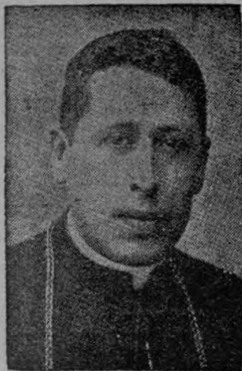
Mons. Victor Sanabria.