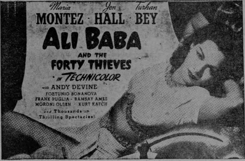
"ALI BABA Y LOS 40 LADRONES"

REAPARECE LA ESTRELLA MUERTA! EL CUENTO MAS MARAVILLOSO DEL LIBRO MARAVILLOSO!