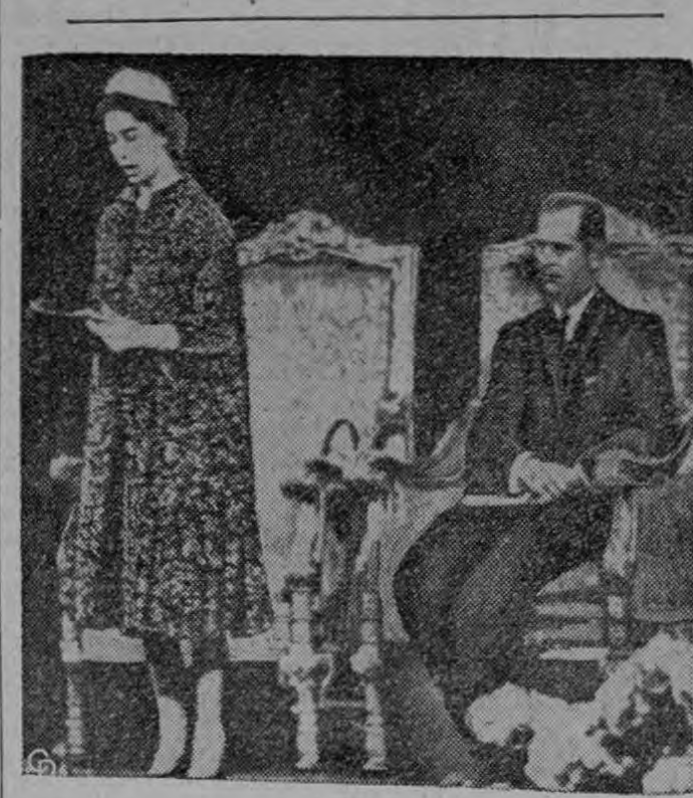
REINA INAUGURA CONGRESO.—La Reina Isabel II de Inglaterra se dirige a 650 delegados de 14 naciones que asisten a la Conferencia del Atlántico en Westminster Hall, en Londres. A su lado, el príncipe Philip, duque de Edimburgo. La reina alenó a la conferencia de la NATO para establecer un "amplio liderazgo" para las naciones del Atlántico