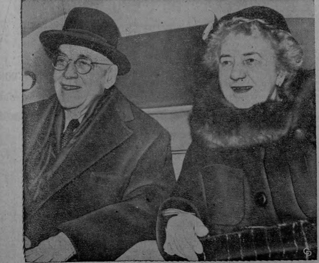
El Secretario de Estado John Foster Dulles dice que se está sintiendo "muy bien", y acompañado de su esposa salió en un recorrido por automóvil alrededor de Washington. Dulles estuvo fuera durante hora y media, lejos de su cama de enfermo en el Hospital Walter Reed donde ha estado recibiendo tratamiento con rayos X para un cáncer abdominal. Esta fue la primera vez en ser retratado desde el 10 de febrero