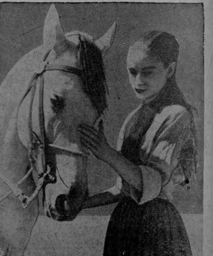
En su primer día de vuelta en los estudios para la película "The Unforgiven", en Durango, México, la actriz Audrey Hepburn acaricia al caballo que la lanzó a tierra hace un mes. Los golpes que recibió en la espalda en la caída, a pesar de que han cicatrizado, le obligan a trabajar diariamente sólo tres horas.