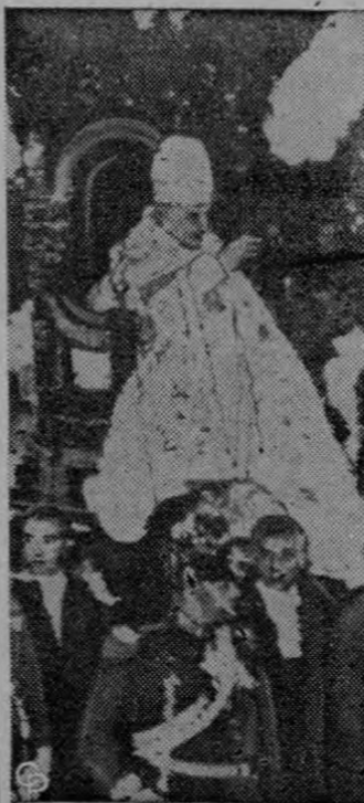
ANIVERSARIO.—El Papa Juan XXIII es cargado hacia la Basílica de San Pedro en la Ciudad del Vaticano para una ceremonia especial en honor del primer aniversario de su coronación. La colorida procesión tuvo la participación de 24 cardenales, y fue presenciada por 30.000 personas.