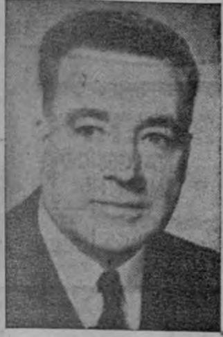
Dr. Harold B. Lee

El Dr. Harold B. Lee, miembro del Concilio de los Doce Apóstoles de la Iglesia de Jesucristo de los Últimos Días y Dr. en Humanidades de la U. S. A. C. llegará a Costa Rica mañana martes 10 de noviembre.