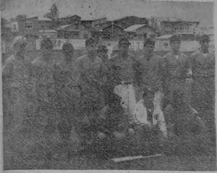
He aquí a los componentes del equipo Liceo de Costa Rica (Sección Diurna) que al vencer a los del conjunto Liceo de Costa Rica (Sección Nocturna) obtuvo el título de Campeón Intercolegial de Beisbol de 1959. ¡Felicidades muchachos!