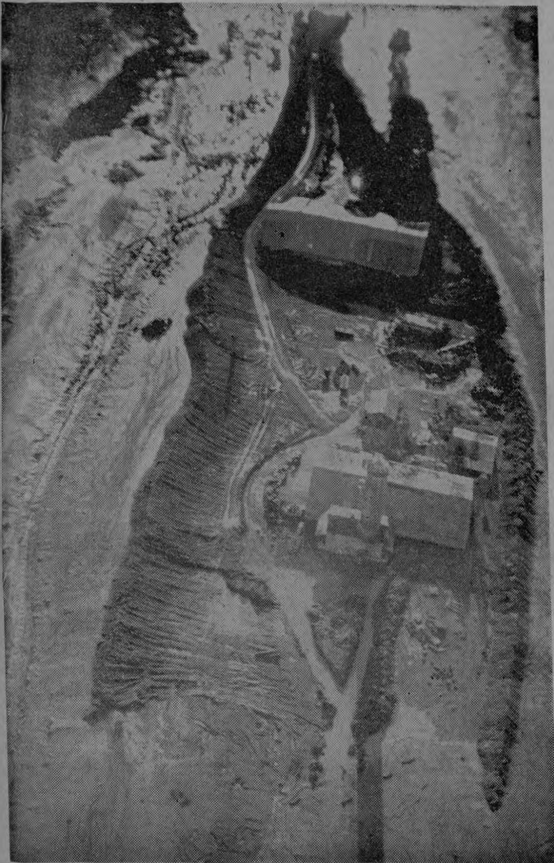
DIQUES SALVADORES. — Esta fotografía aérea fue tomada hoy a las 06:30 Hs. desde una avioneta sobre la Fábrica Kativo en la zona de Taras. Se aprecia a la izquierda la avalancha de lodo que fue contenida por los diques que, en forma de embudo, protegen las últimas instalaciones que Kativo mantiene en el área peligrosa de San Nicolás. En