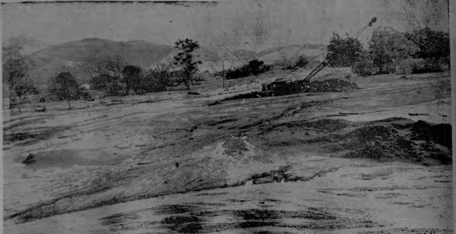
MAQUINARIA ATASCADA. En medio de un pantano gigantesco, con lodo de tres metros de alto, varios tractores y esta pala mecánica quedaron hundidos sufriendo algunos daños de consideración. Exactamente esta fotografía (notar los cables eléctricos) corresponde a la ruta que lleva la Carretera Nacional a Cartago, hoy sepultada en lodo como se aprecia en esta gráfica de Lizano.