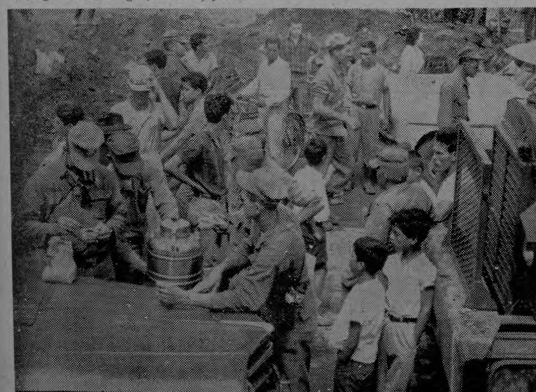
PARALIZADOS LOS SEA-BEES.— En Cinco Esquinas de Cartago los "Sea-Bees" quedaron paralizados esta mañana. El lodo de gran profundidad y aún lleno de agua, impidió que la maquinaria de estos constructores soldados pudiera operar con seguridad. Mientras el material de la avalancha se endurecía los soldados tomaban café!