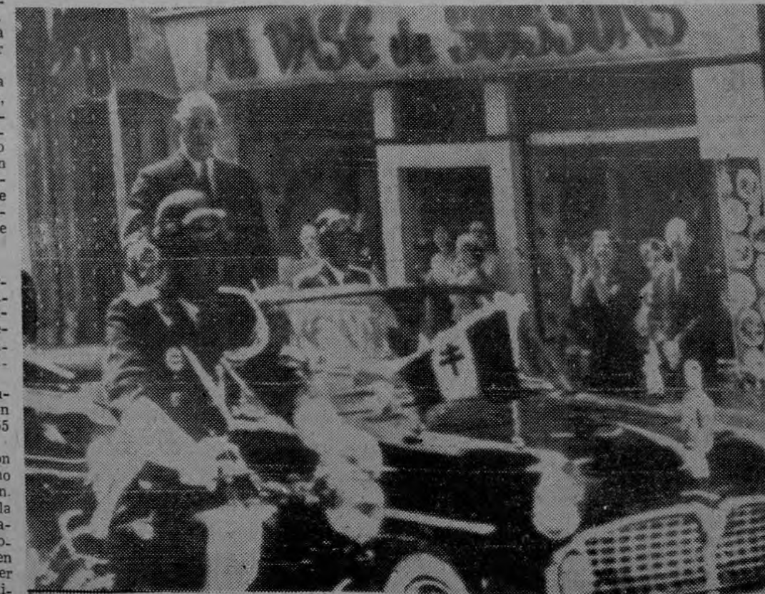
SOISSONS, Francia, 12.— El Presidente Charles De Gaulle de Francia está parado en un auto abierto luego de llegar ayer aquí al iniciar una gira de cuatro días por la provincia francesa de Rueda.

Pero el Primer Ministro dijo hoy, como ayer, que había solicitado la suspensión porque había habido "una calma en la zona de operaciones".