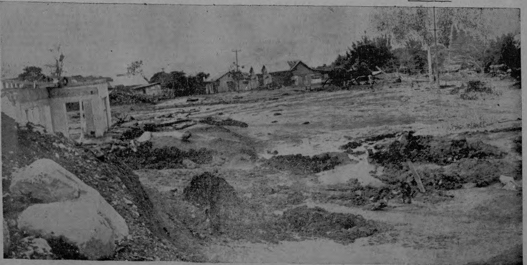
AQUI PASABA LA CARRETERA. — Varios metros de lodo sepultaron una vez más la Carretera Nacional a Cartago en la zona de San Nicolás o Taras. La fotografía es elocuente. De

Se nos apuntó la necesidad de que los propios vecindarios colaboren con la Municipalidad josefina en este plan extraordinario. Esos vecindarios pueden llamar a la Corporación en solicitud de suministro de agua cuando en sus barrios esté haciendo falta. Y una vez se presienten los camiones-tanque, o denadamente se surten del precioso elemento.