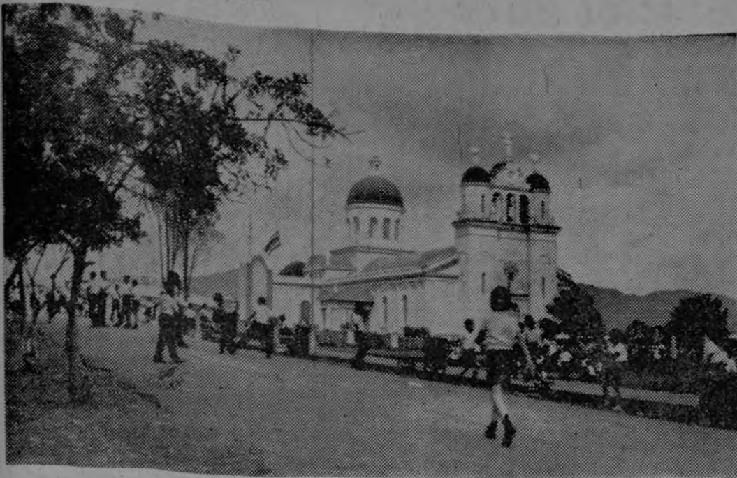
Niños alegres jugando en uno de los recreos, la mayoría de ellos necesitan del Comedor Escolar, que será una realidad si hallan cooperación en esta obra de bien social.