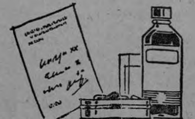
CANTIDADES MAYORES A LAS INDICADAS POR EL MEDICO.