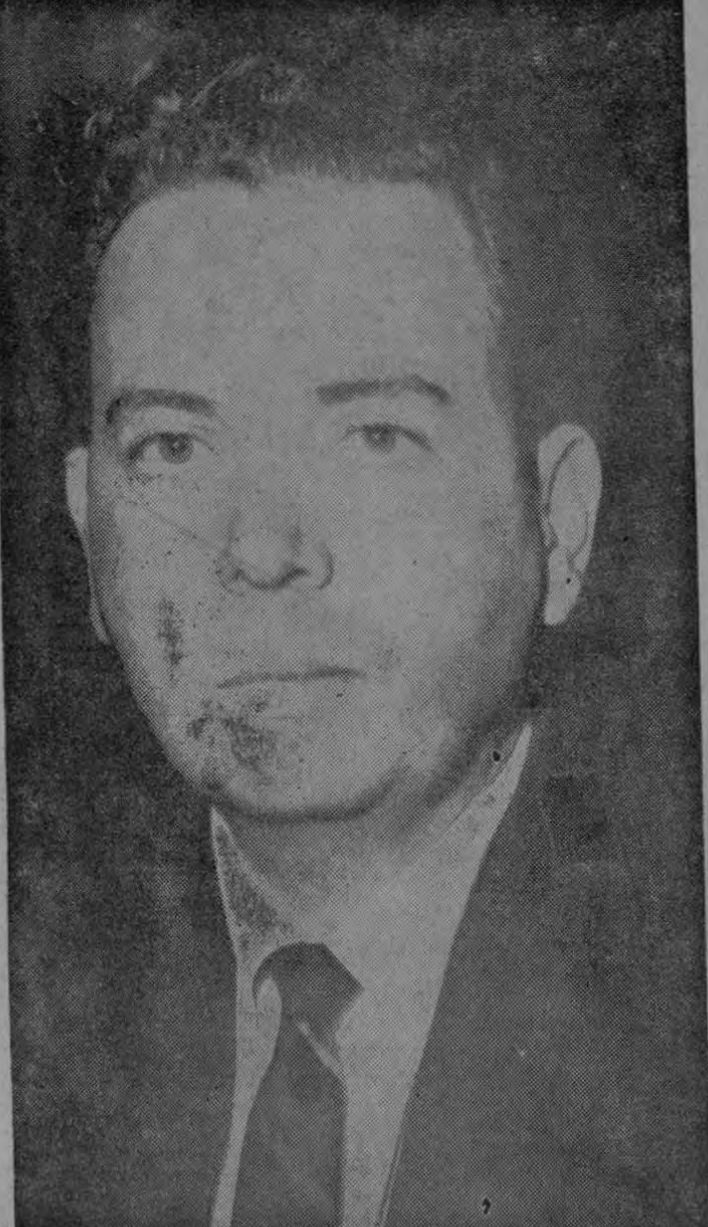
NUEVA YORK, 20.—(AP)—Este es Manuel Manolo Ray Rivero, el que fuera uno de los más fieles colaboradores de Fidel Castro, y que ahora manda la organización anti-castrista, conocida como Junta Revolucionaria (JURE). Por más de un año, Rivero ha anunciado su plan de regresar a Cuba, antes de 20 de mayo o morir en su esfuerzo de derrocar la dictadura comunista de Castro.

Es opinión generalizada de que el calzado se vende a elevado precio, ¿la tasa arancelaria a la importación es culpable del actual costo del calzado?