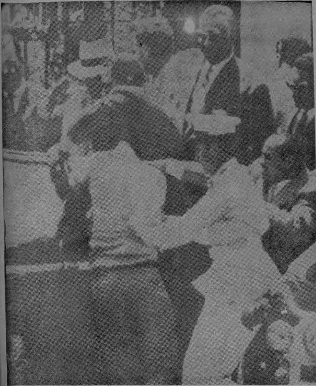
PORT SAID, Egipto, Mayo 20, (AP).— Un policía y guardaespaldas civiles tratan de alejar a un hombre del vehículo abierto del Primer Ministro Khrushchev, sombrero blan-

rinos nucleares rusos en Argelia. Ben Bella visitó recientemente Moscú. Se anunció entonces que la Unión Soviética había concedido a Argelia ayuda financiera y técnica.