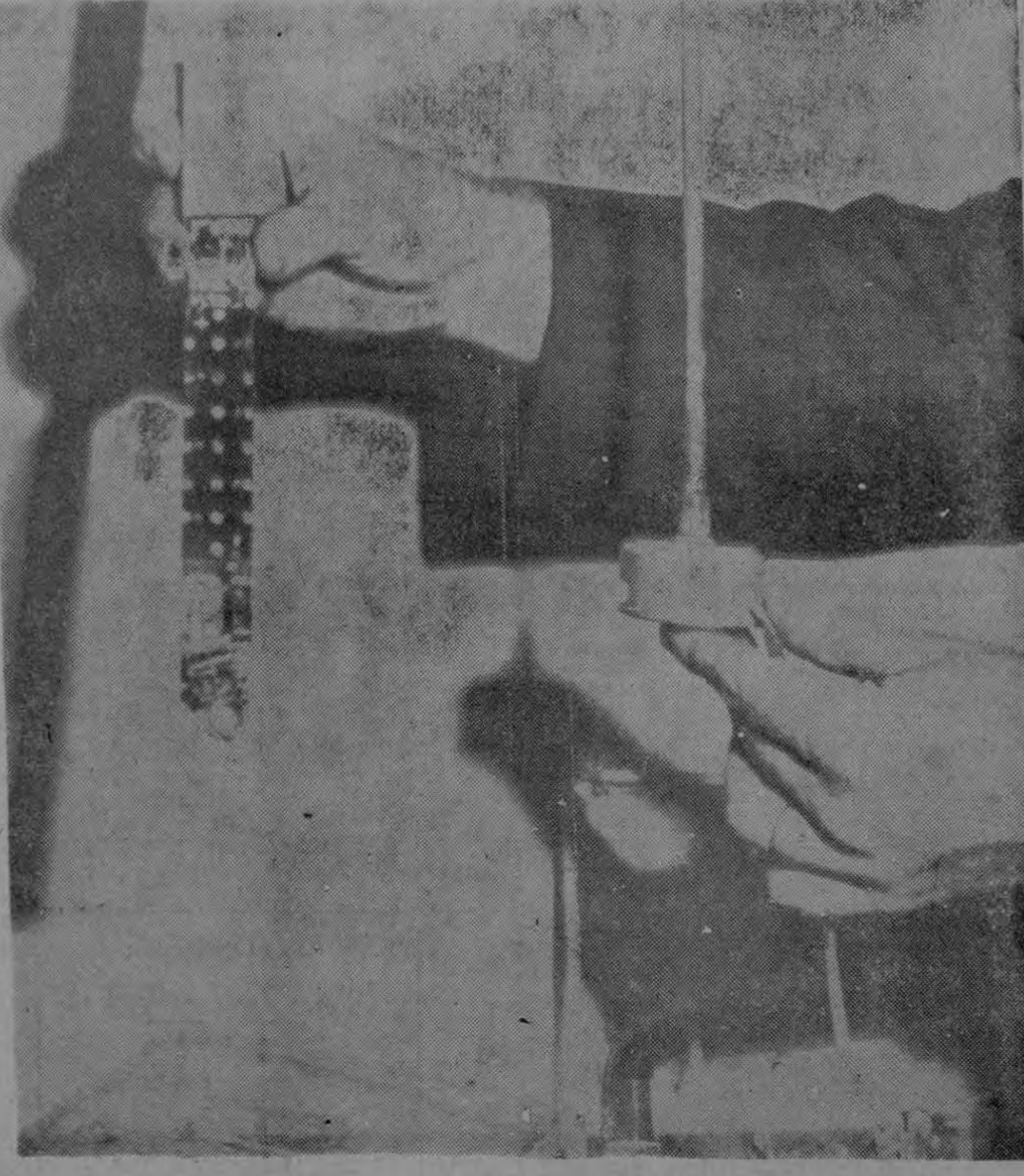
WASHINGTON, Mayo 20.— (AP) —Algunos de los artefactos electrónicos para escuchar mostrados en el Departamento de Estado ayer cuando se reveló que una red de 40 micrófonos ocultos se descubrió en las paredes de la embajada de los E.E.U.U. en Moscú.—(WIREPHOTO "AP" exclusiva de LA PRENSA LIBRE).

de Ganaderos, que los ganaderos de la llamada "zona de verano" son culpables de los altos precios de la carne por la violación que hacen de las medidas sobre provisión de ganado para el consumo interno. La carta del señor Lorenzo —Pasa a la Pág. CUATRO