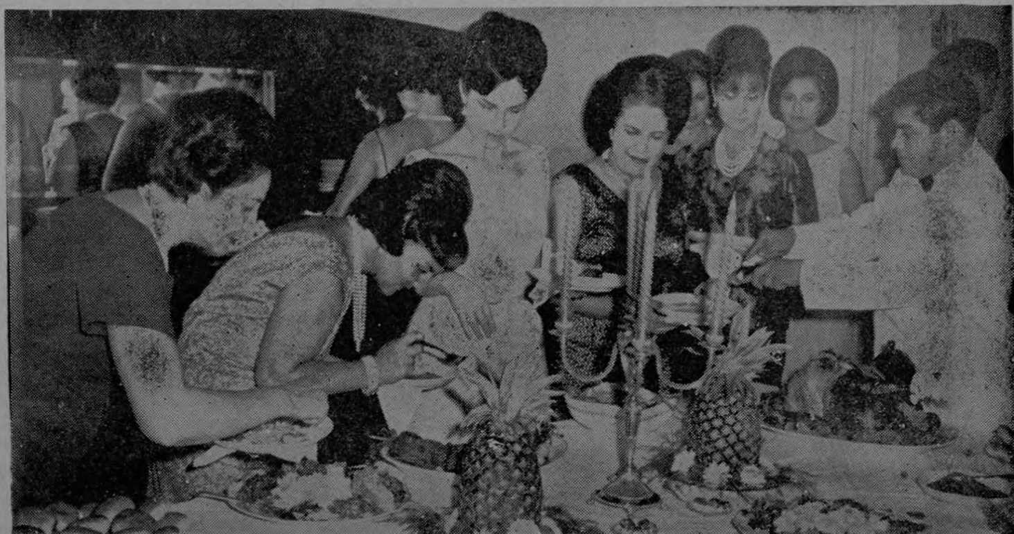
Una mesa hermosamente decorada, invitadas elegantemente ataviadas, alegría y armonía... esas fueron las características de la recepción ofrecida por el Encargado de Negocios de Portugal y la Sra. de Salcedas.

LA PRENSA LIBRE se complace en hacer llegar su más cordial saludo al Encargado de Negocios de Portugal y la Señora de Salcedas, agradeciéndoles las finas atenciones tributadas a sus representantes, en esa noche.