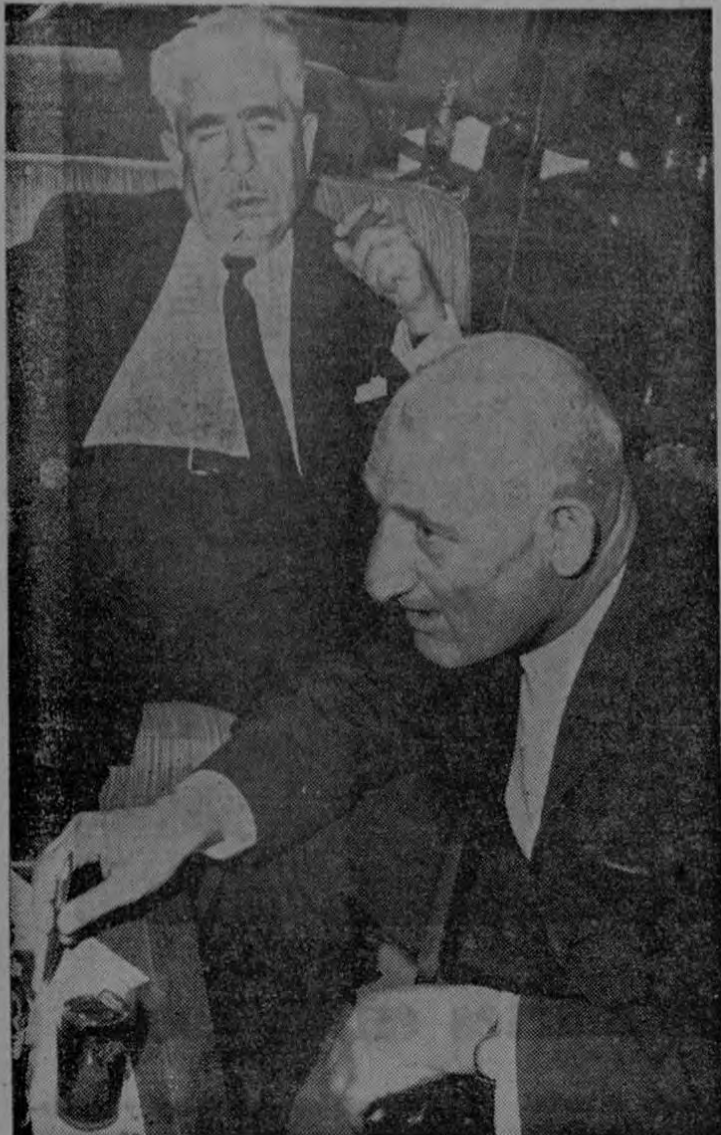
Los problemas que confronta el reino de Jordania, respecto a la desviación de las aguas del río Jordán por el Estado de Israel, y la presencia en tierras jordanas de 700.000 judíos, fueron expuestos a la prensa nacional por el señor Ministro de Relaciones Exteriores de Jordania, en una conferencia convocada al efecto. El Canciller jordano fue acompañado por el Embajador del mismo país en Chile, durante la reunión.

Al consignar tan grato acontecimiento, LA PRENSA LIBRE les hace llegar por este medio, hasta su residencia los votos que formula por la felicidad de su ejemplar hogar.