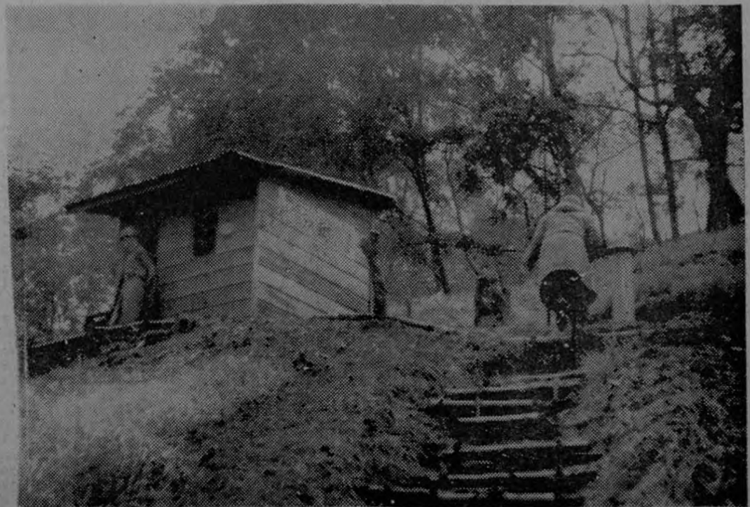
Este es el Puesto Nº 1 de la Guardia Civil en el curso superior del Tiribí cerca de Llano Grande, enclavado en una prominencia que da directo sobre el profundo cañón del Río en esa zona. En la fotografía dos