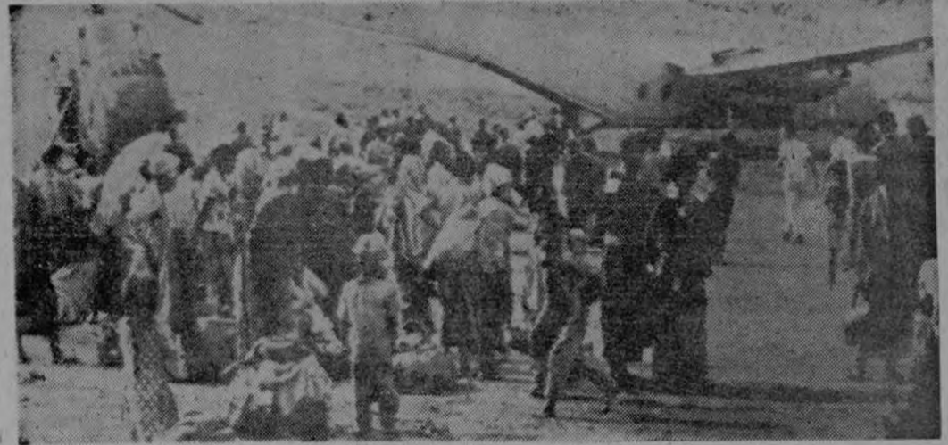
LLANURA DES JARRÉS, Laos, mayo 27 — —Un grupo de mujeres y niños y triboños Meos esperan en una pista de aviación hoy en el sector de la Llanura des Jarrés, en Laos, hoy, que sean llevados a Vientiane, a