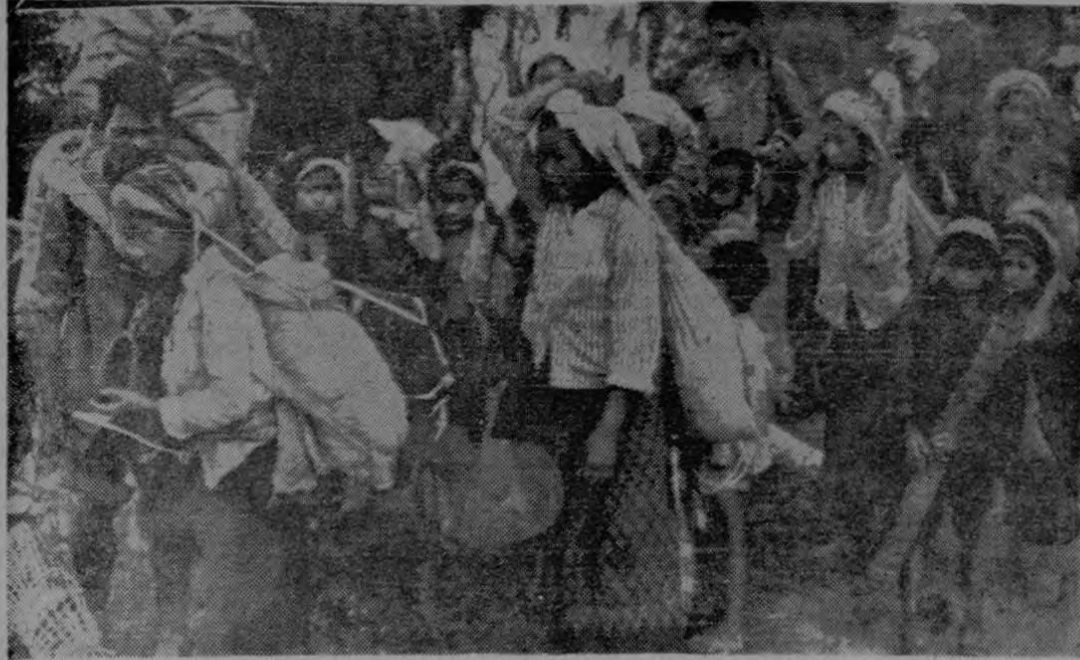
BORIKHANE, Laos, mayo 27 (AP).—Mujeres y niños acompañados por soldados neutralistas llegan agotados al puesto de Borikhane, en el centro de Laos, después de una caminata de 120 kilómetros a través de la selva huyendo de los ataques comunistas cerca de los Llanos des Jarrés. (WIREPHOTO (AP) exclusiva de LA PRENSA LIBRE).