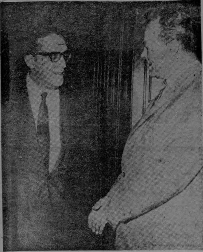
BERLIN, 27 de mayo, (AP).—Carlos Lacerda, gobernador de Guanabara, conferenció hoy con el alcalde de Berlín occidental, Willy Brandt, derecha, en el ayuntamiento. Lacerda anda de viaje por Europa desde poco después del derrocamiento del gobierno de Joao Goulart.