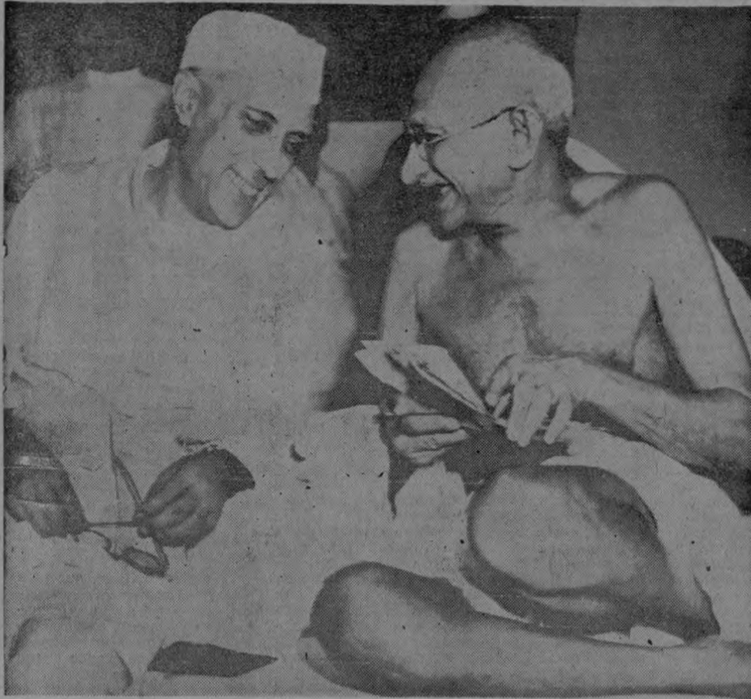
NUEVA YORK, Mayo 27.— AP.— El Primer Ministro Nehru, que murió hoy, es visto con el extinto Mohandas K. Gandhi, derecha, líder de la lucha de la India por