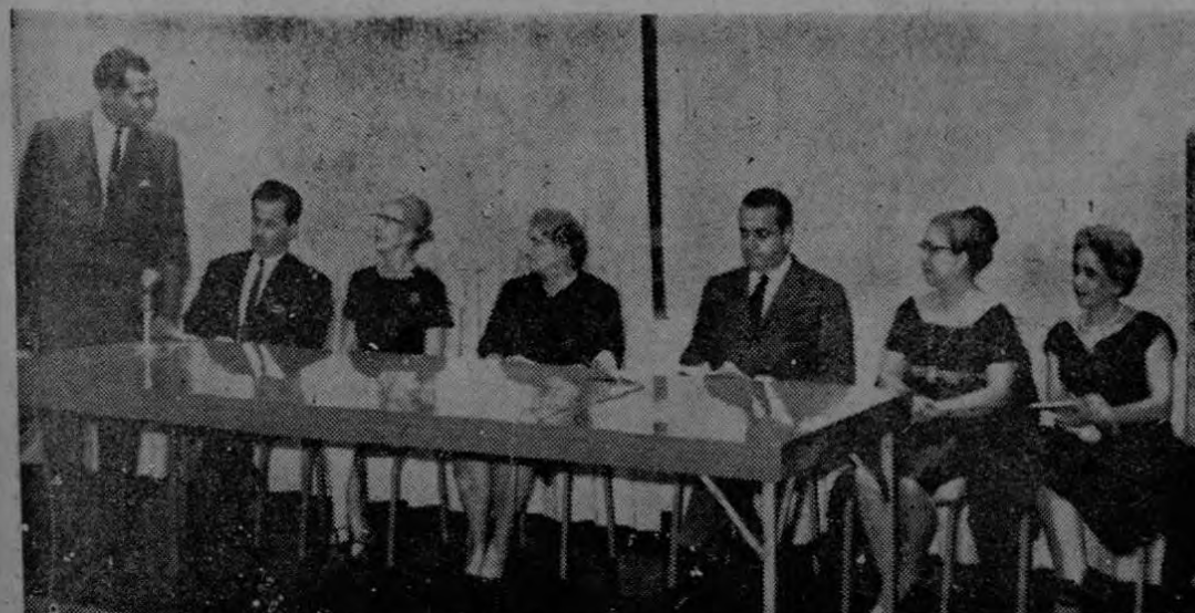
MESA DE CLAUSURA.—Reproduce la gráfica uno de los momentos de la clausura del Seminario que sobre Bienestar Social de Centro América y Panamá se verificó en es-

Claro está que si a lo largo del Código encontráramos algún error de concepto y no de simple escritura o tipográfico, será preciso corregirlo mediante una ley que no dudamos se tramitará