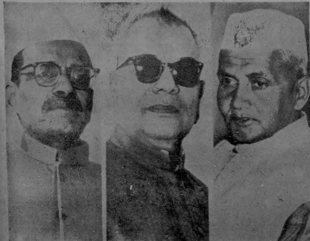
T. Krishnamachari y Lal Bahadur Shastri, izq. a derecha, son los principales candidatos a suceder a J. Nehru como Primer Ministro de la India. Nanda es el interino