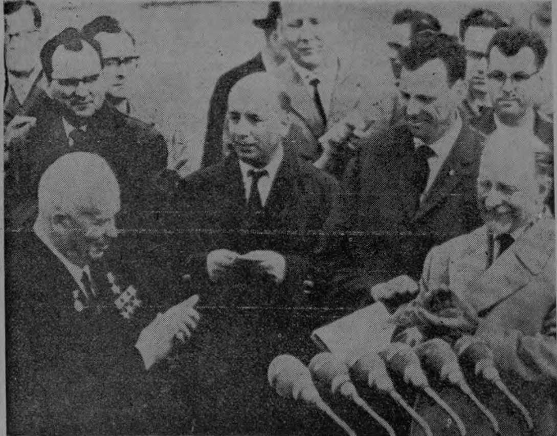
MOSCU, 30 de mayo.—El Jefe de Gobierno ruso Nikita Khrushchev, izq. frente, con Walter Ulbricht, jefe comunista alemán oriental, derecha se aplauden al llegar Ul