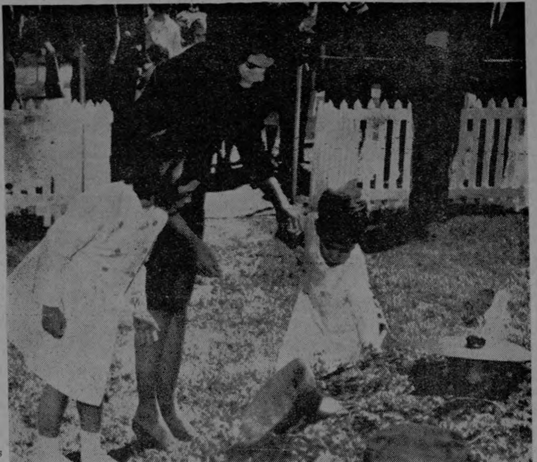
WASHINGTON, 30 de mayo.—John Kennedy, de 3 años de edad, coloca flores en la tumba del Presidente Kennedy ayer. Fue al cementerio con su madre y su hermana Carolina. Kennedy cumpliría hoy 47 años. Es

Se anunció que la huelga es indefinida y que probablemente se extienda a las instalaciones de la empresa en el Estado de Falcon y Oriente.