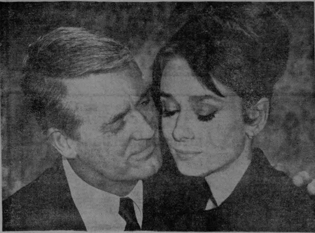
Cary Grant, galán de la pantalla por muchos años... y tantos!, que ya podría ser muchas veces abuelo, es, no obstante, uno de los actores mejor cotizados del momento. En esta foto aparece junto a Audrey Hepburn, otra magnífica actriz, en "Charada".