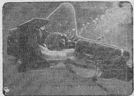
Los secretos de Neptuno no tardarán en ser revelados al público por una nueva cámara para fotografías submarinas de la Armada Norteamericana. La Cámara aparece aquí siendo usada por un buzo-fotógrafo en aguas de Anaostia, Distrito de Columbia.