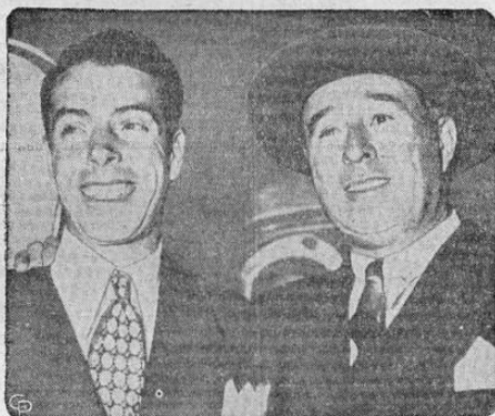
Joe Di Maggio (izquierda) de los New York Yankees y Frank (Lefty) O'Doul, mánager de los San Francisco Seals de la Liga de la Costa del Pacífico, aparecen aquí sonrientes al salir por avión de San Francisco, en gira por el Japón y la Corea