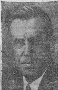
Henry A. Wallace