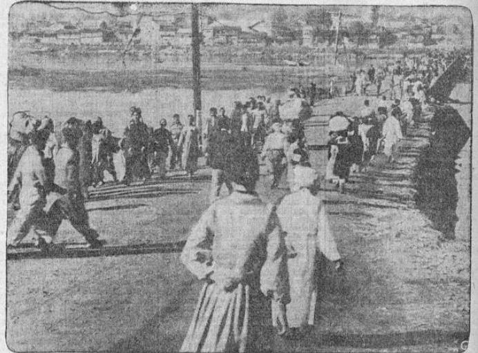
Intenso es el movimiento por este puente de las vecindades de Pyongyang en el Norte de la Corea, al moverse en ambas direcciones millares de refugiados que tratan de huir de las zonas de combate. (INP).