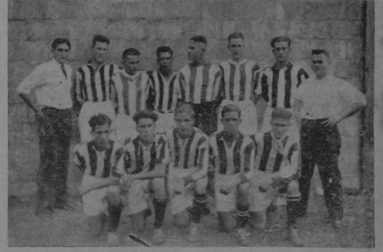
Equipo del Club Sport "La Libertad" que jugará mañana el primer match internacional con el poderoso cuadro chileno "Audax"

A la Libertad le corresponde bastantear las acciones de este poderoso equipo chileno y después del cotejo podremos predecir lo que ocurrirá en el futuro.