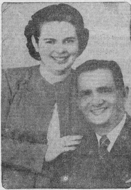
Rafael Simón Urbina, que aparece aquí con su esposa, fué el líder del grupo armado que asesinó al Presidente de la Junta de Gobierno de Venezuela, teniente coronel Carlos Delgado Chabaud. —.