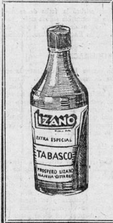
Passa a la Pág. OCHO