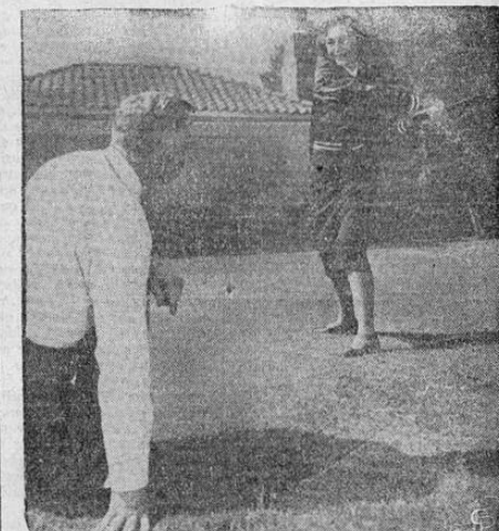
Casey Stengel, el mánager de los New York Yankees, aparece aquí de vacaciones en su rancho de Glendale, California, donde proyecta permanecer hasta que comiencen los entrenamientos para la temporada de 1951. En esta serie de tres fotografías se ve a Casey con su esposa. Los médicos han aconsejado a Casey que se abstenga de banquetes y discursos durante el Invierno.