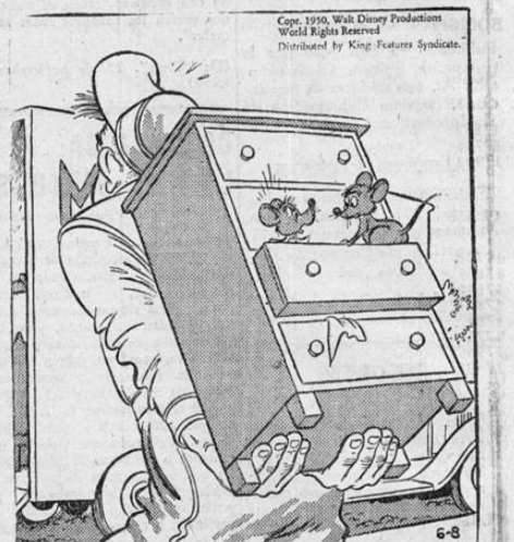
Ojalá pagaran el alquiler. Estoy cansado de andar siempre de mudanza.