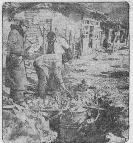
Rifle en mano, el teniente norteamericano Joseph Booth, vigila a dos coreanos que desenterran barriles de petróleo enterrados por los rojos en la Corea. Los rojos enterraron esos barriles por temor a los bombardeos aéreos de los aliados.