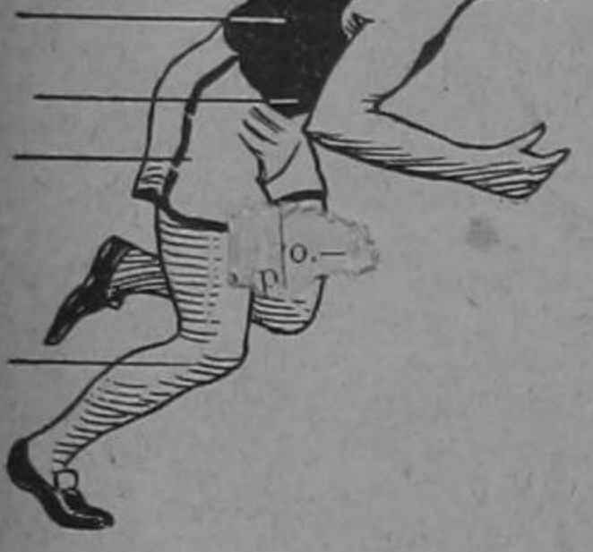
El entrenamiento de la Gimnástica

Ayer estuvimos en el Estadio para presenciar el entrenamiento de la Gimnástica que el próximo domingo actuará contra el cuadro chileno Audax, y salimos de ahí gratamente impresionados.