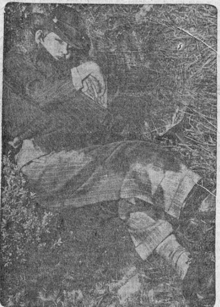
Con su pistola junto a él, Griselio Torresola, nacionalista puertorriqueño yace sobre el césped cerca de la Mansión Blair. Torresola fue muerto por los guardias de la Casa Blanca.