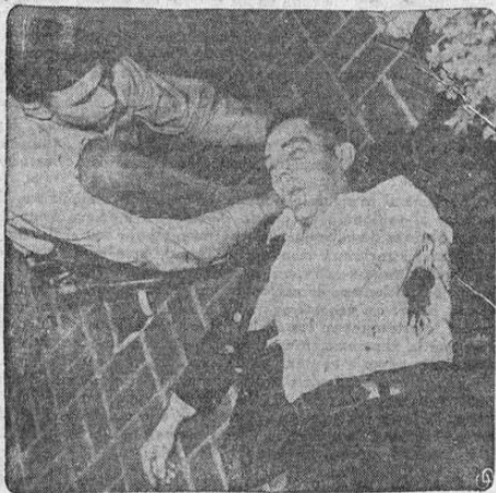
Un transeunte va en ayuda de uno de los tres guardias que fueron heridos en el tiroteo que ocurrió frente a la Mansión Blair, residencia oficial del Presidente Truman en Washington.