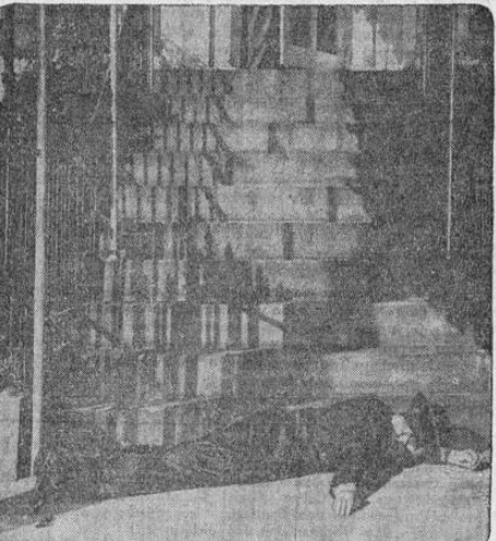
Oscar Collazo, nacionalista puertorriqueño que cayó herido, en la escalinata de la Mansión Blair. Collazo y Torresola trataron de abrirse paso a balazos por entre la Guardia presidencial, y de penetrar en la Mansión Blair, con el propósito de asesinar al Presidente Truman.