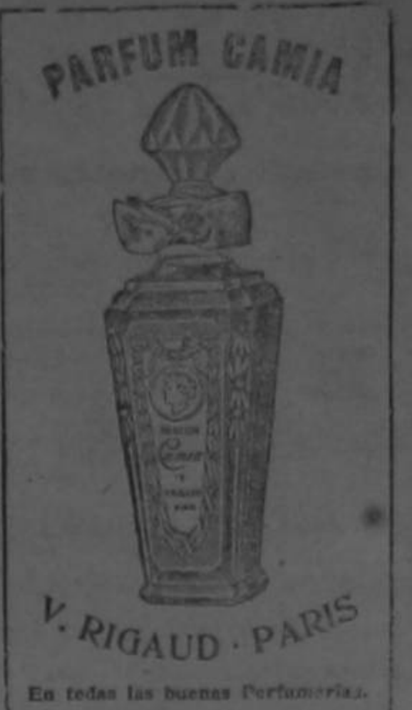
En todas las buenas Perfumerías.