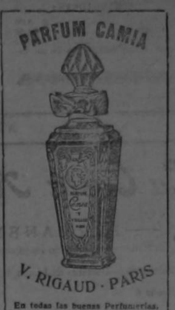
En todas las buenas Perfumerías.