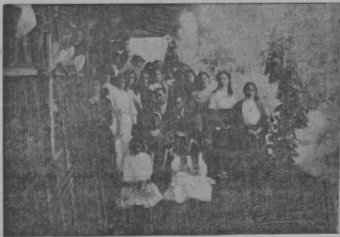
Grupo de señoritas y caballeros que asistieron al almuerzo de anteayer, en Desamparados.

El vecino pueblo de Desamparados estuvo de gala antier domingo, con motivo de la colocación de la primera piedra del templo nuevo, que gracias a la tenacidad de los católicos vecinos será dentro de poco una hermosa realidad.