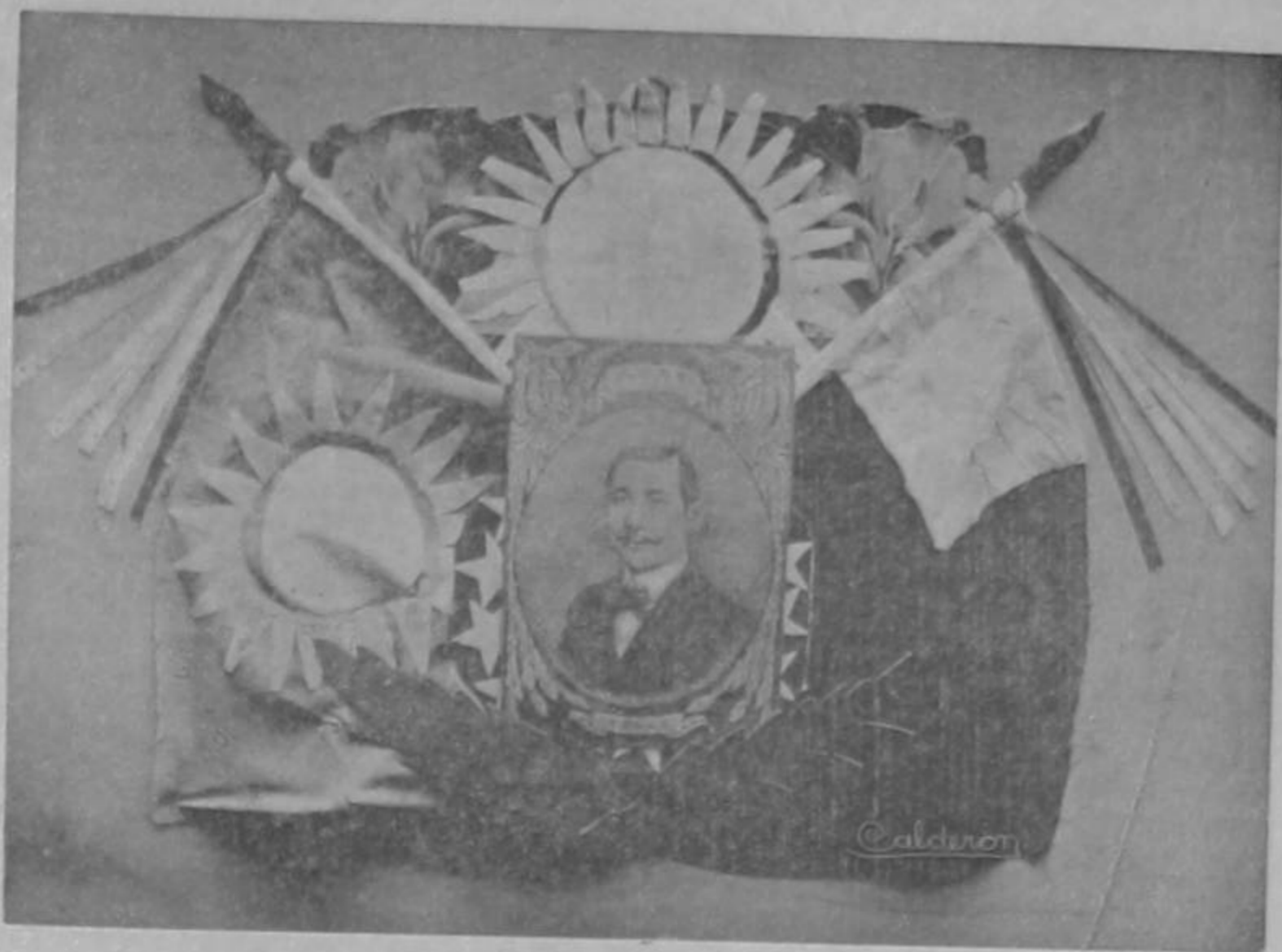
DR. SUN YAT SEN

Iniciador y Jefe de la Revolución, á quien correspondía la Presidencia de la República China; pero quien, según los cables de hoy, con un desinterés que agiganta su noble figura política, ha declinado el alto honor en Yuan Shi Kai, para consolidar mejor la naciente organización del País Celeste.