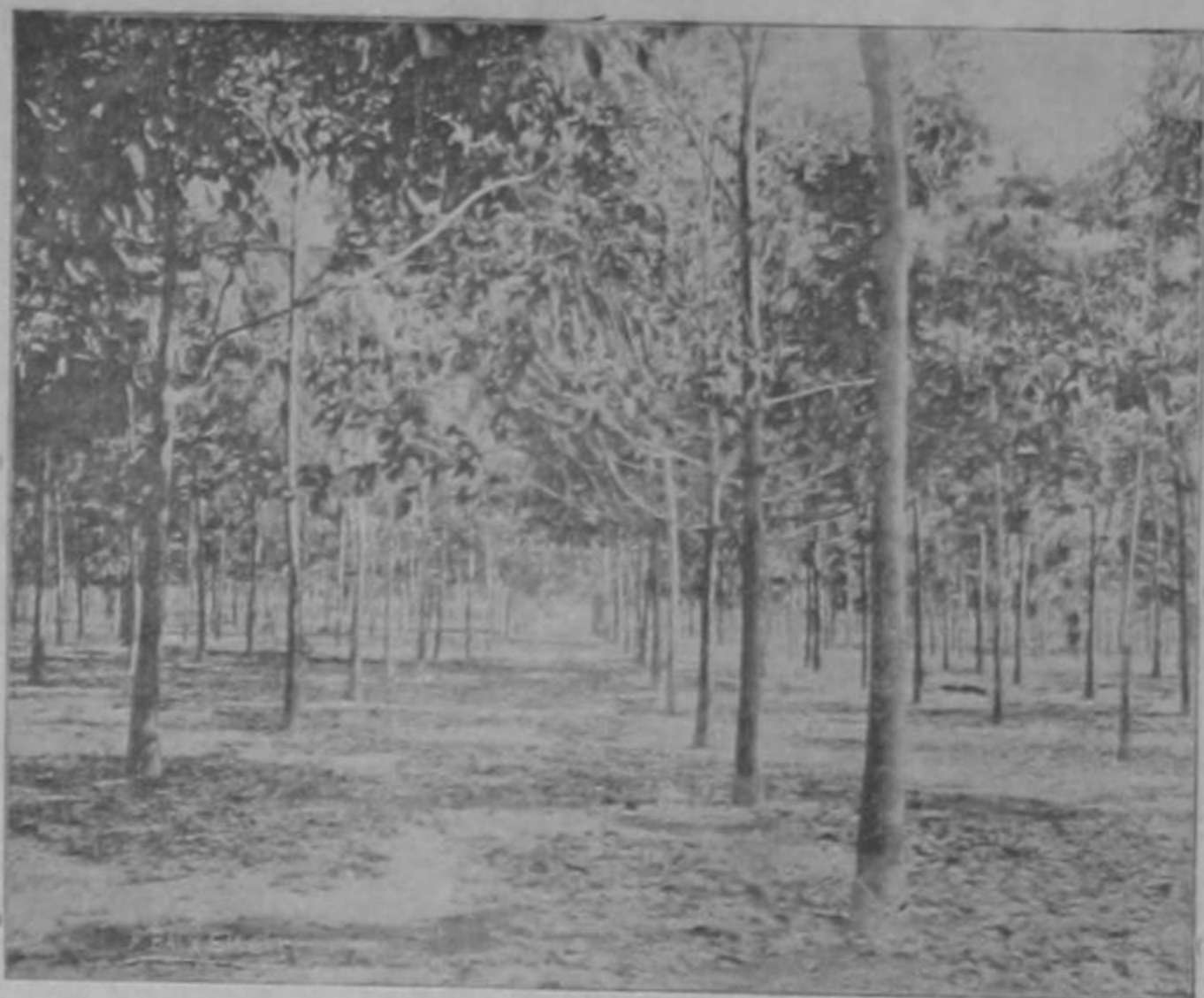
Plantación de hevea (hule) de tres años y medio. Primera sangría.