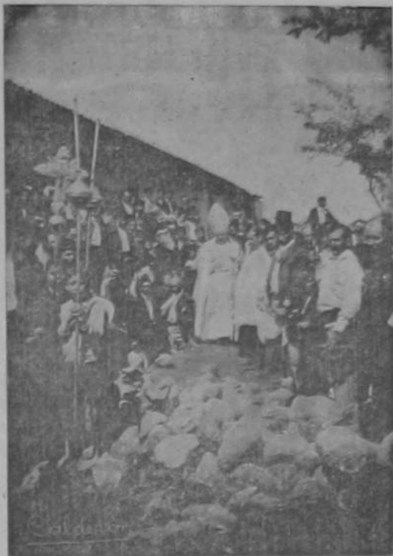
Ceremonia de la colocación de la primera piedra del nuevo templo parroquial de Desamparados