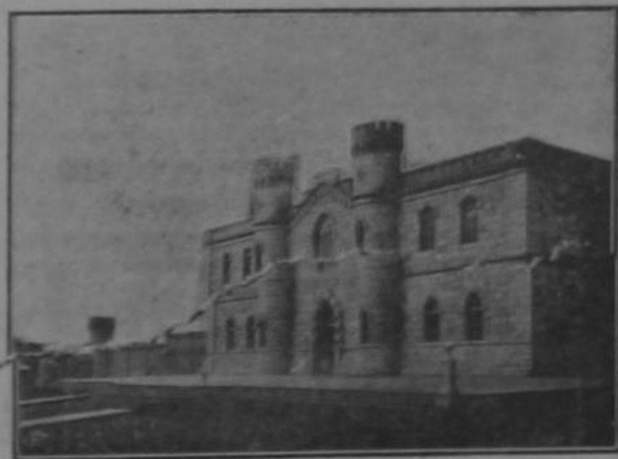
Fuó visitada ayer por nuestros huéspedes de E.E. U.U.