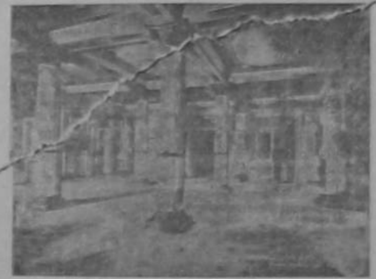
Entrada del Teatro Nacional de Costa Rica