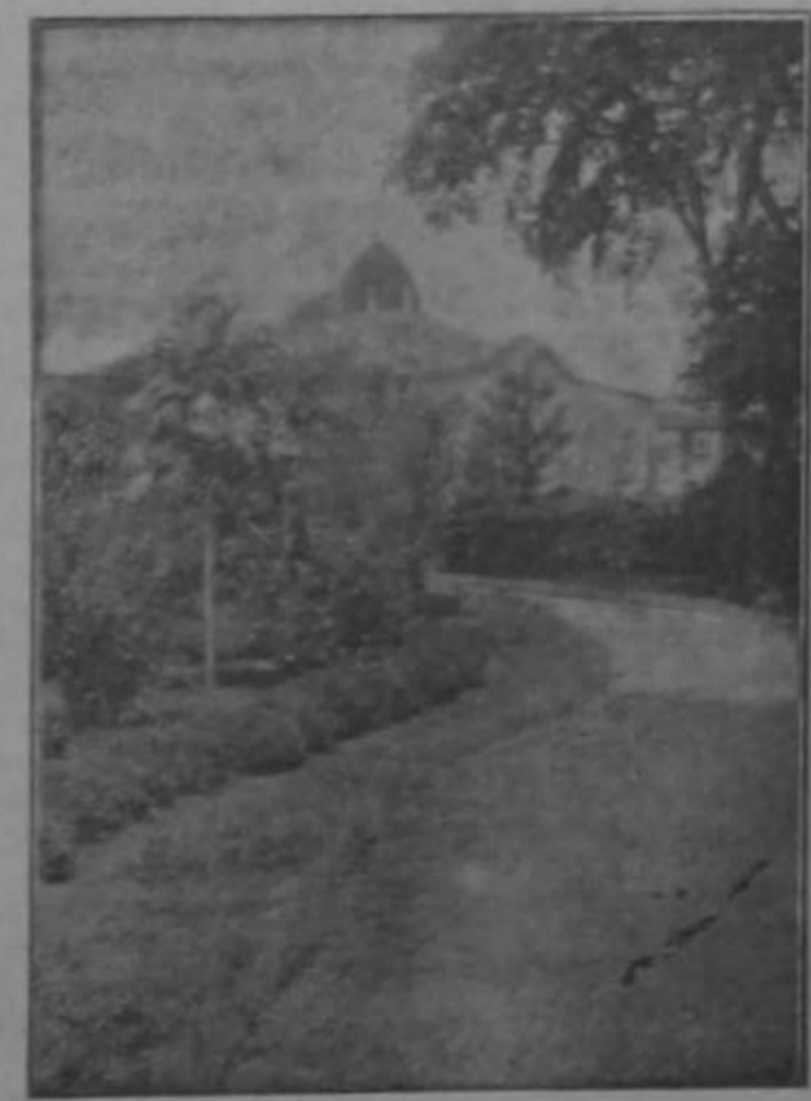
Nuestros visitantes fueron ayer al Asilo Chapuí, que les causó verdadera admiración.