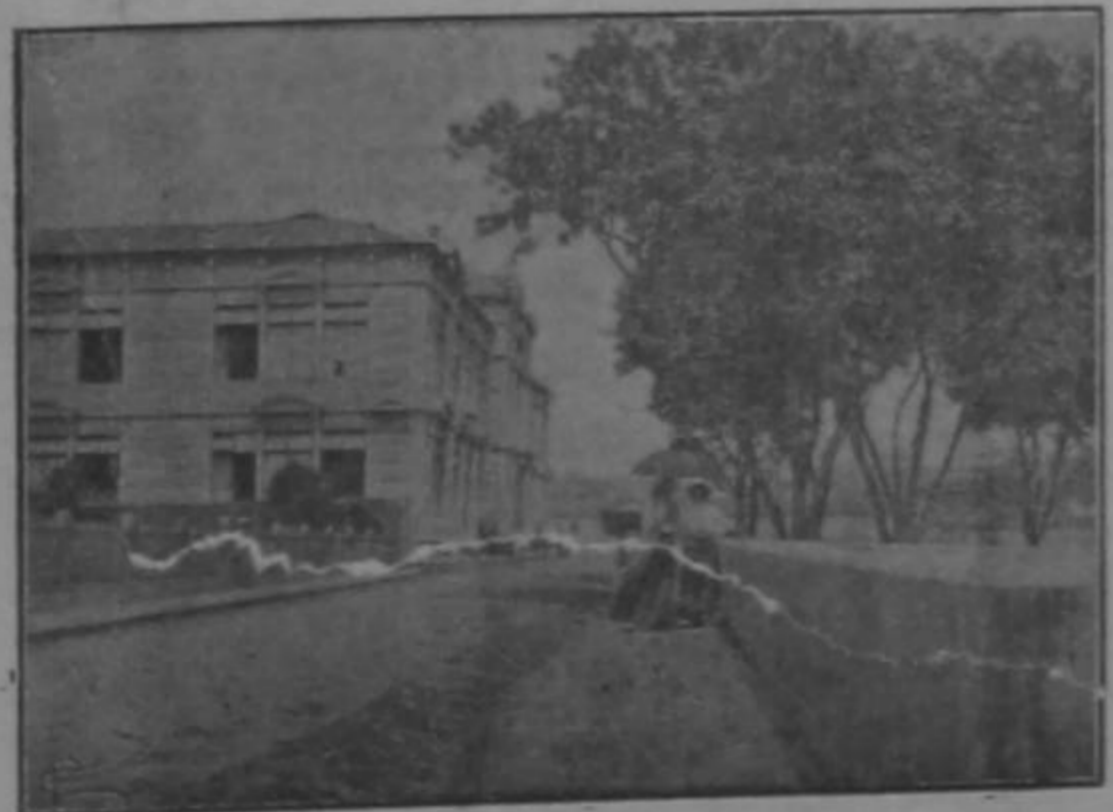
Calle frente al Edificio Metálico y Parque de Morazán, en donde residen el Honorable Secretario Knox y su familia.