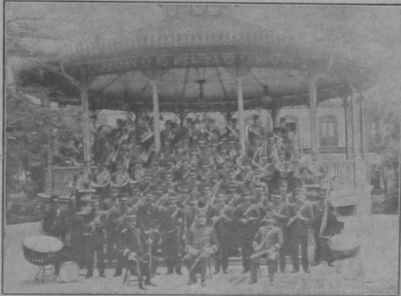
Hoy dará un concierto de gala á las 5 p. m. en el Parque Morazán, dedicado á la Delegación de Estados Unidos.