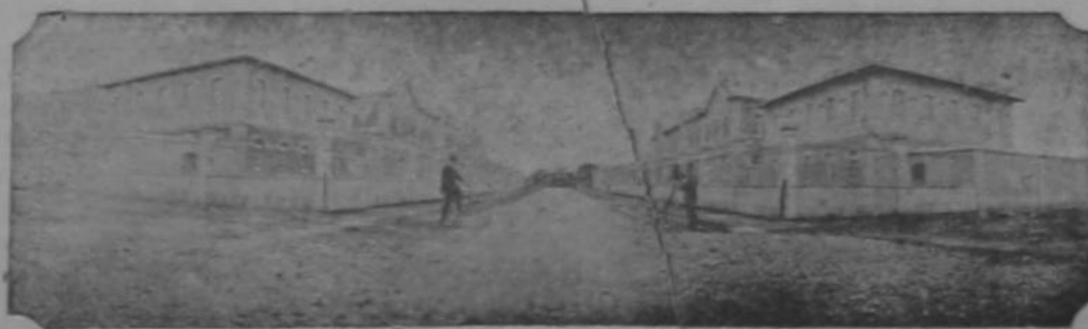
En la mañana de ayer lo conoció el Secretario Knox. Fué de su agrado