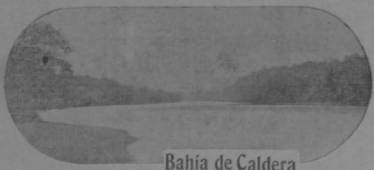
Bahía de Caldera

Dirección y Redacción: Entre la Av. 12. E. y la Calle primera Norte. Teléfono Núm. 109 Apartado 175