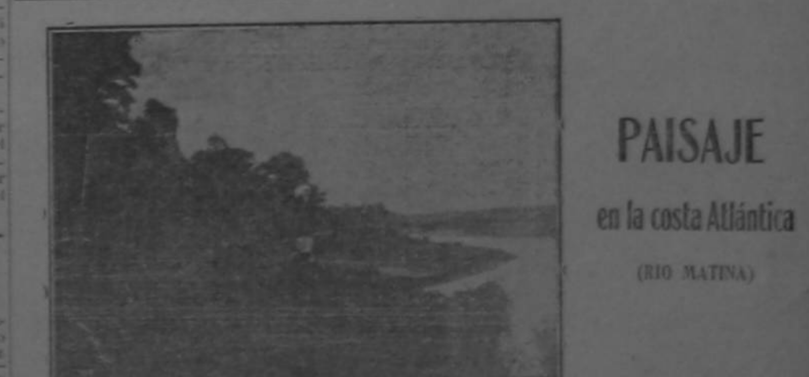
PAISAJE en la costa Atlántica (RIO MATINA)

Abatísimos, para terminar, que el aplauso local estaba casi lleno, y que en los palcos vimos a muchas de las damas y caballeros más distinguidos de nuestra sociedad.