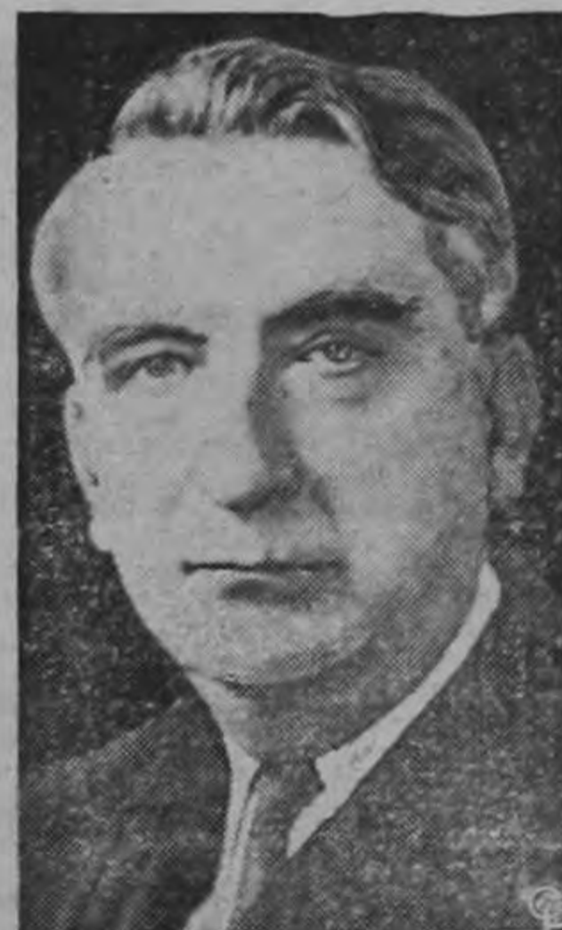
FRED M. VINSON, Juez Supremo de la Corte de los Estados Unidos de Norteamérica, falleció repentinamente en Washington.