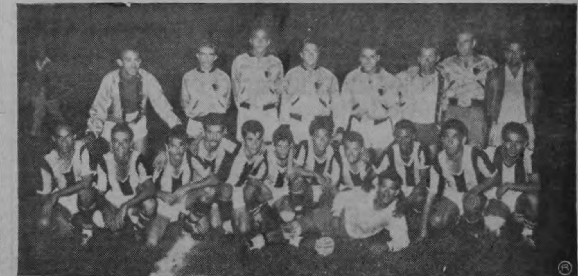
Aparece en la gráfica el conjunto "Uruguay", uno de los cuadros más rápidos del certamen mayor, que el domingo pasará por una de las más difíciles pruebas.