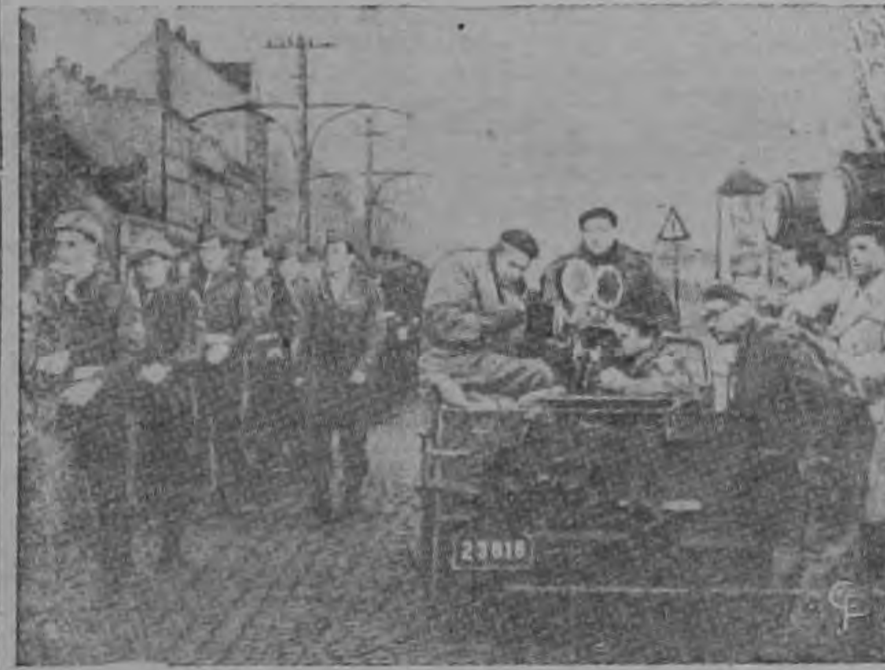
Una cuadrilla de trabajadores cinematográficos rodando la película "Secuestro" que trata de las relaciones entre el Occidente Libre y Checoslovaquia comunista.

ANUNCIADA en forma por demás llamativa se da el caso de la película producida por los Checos en 1952, titulada "Secuestro" la cual ha sido descrita por sus productores como "una cinta en que se muestra la forma en