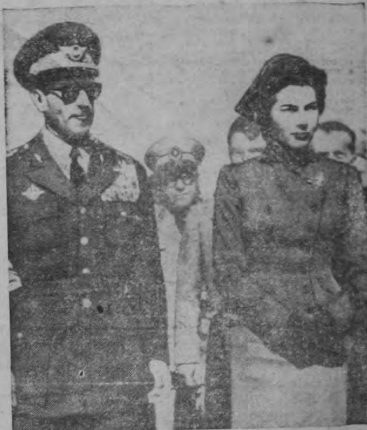
UNA REAL BIENVENIDA esperaba a la Reina Soraya, de 21 años, cuando regresó a Teherán, procedente de Europa, en avión.