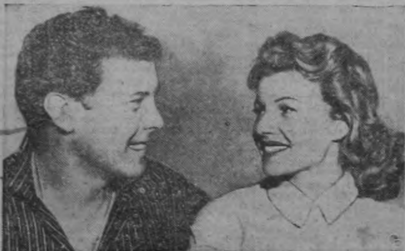
LA ACTRIZ RITA HAYWORTH y el cantante Dick Haymes, en Las Vegas, Nevada, en donde anunciaron que se casarían tan pronto como Dick obtuviese el divorcio, dentro de pocas semanas.