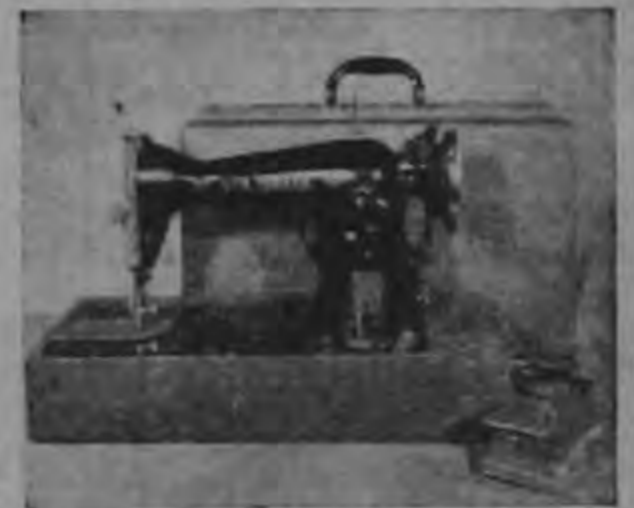
"MAQUINA 'NEW YORKER' PORTATIL ELECTRICA

Las máquinas de coser NEW YORKER son las únicas máquinas de Coser en todo el mundo garantizadas de por vida.