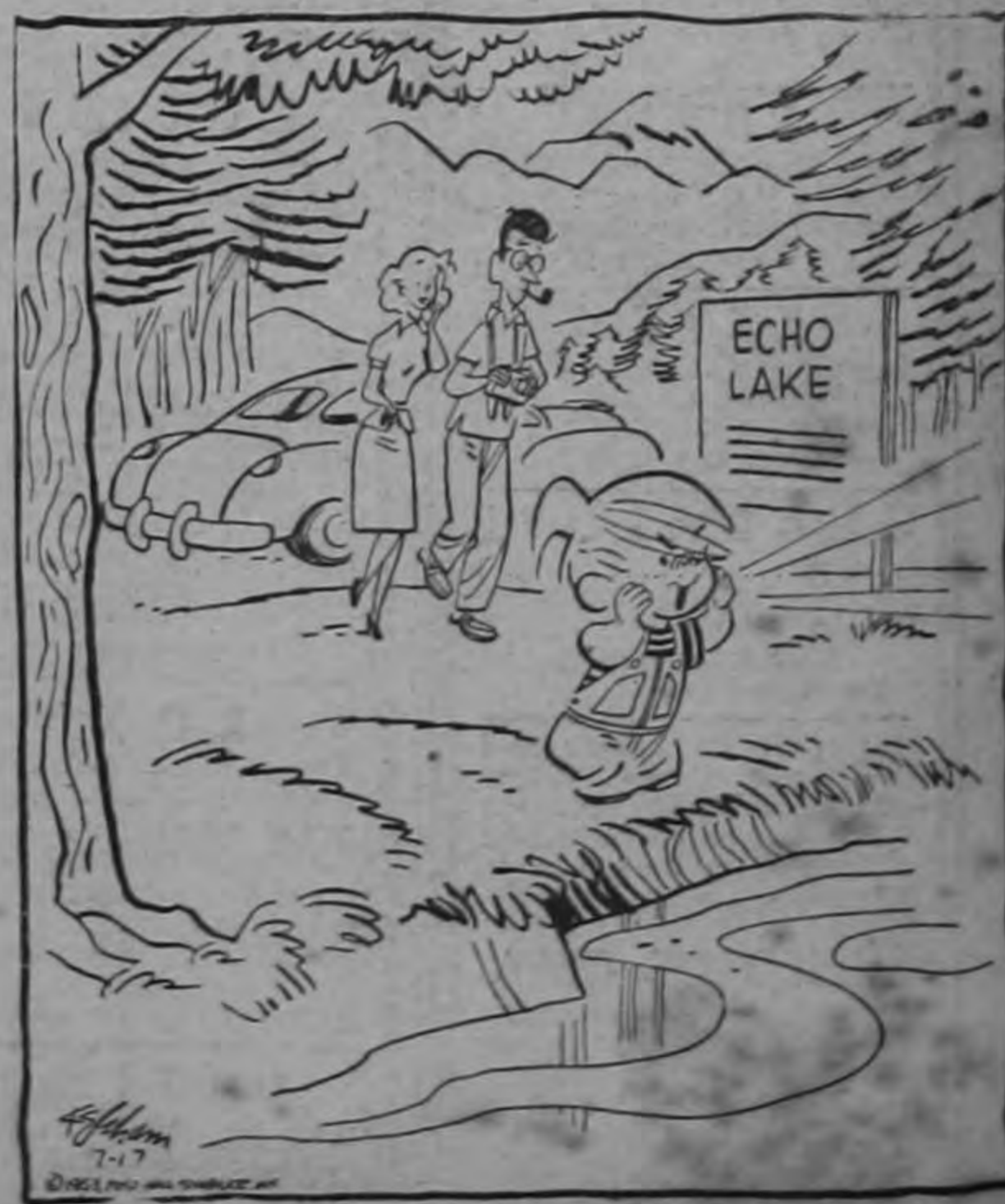
¡Daniel! ¡Tú eres un buen muchachito!