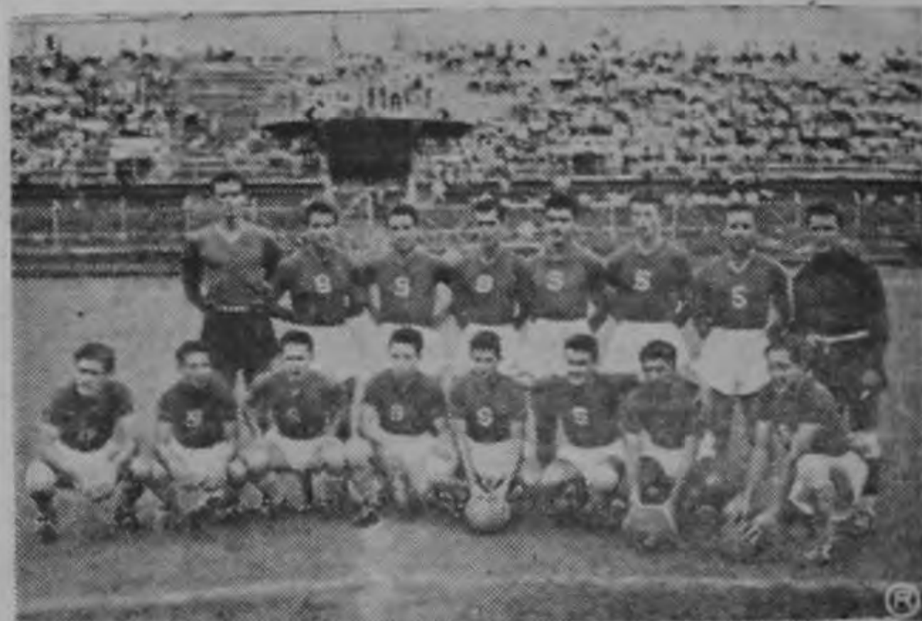
Deportivo Saprissa que el domingo próximo saldrá por tercera vez en el actual Campeonato para cotejarse frente al rápido equipo "Uruguay".

Nuevamente vuelven los morados del Deportivo Saprissa, a la cancha del Estadio Nacional el próximo domingo. De esta vez se batirán en sensacional duelo, frente al rápido conjunto del Uruguay. El cuadro lechero ha hecho dos encuentros en lo que va del certamen, el primero frente al Herediano, a quien en gran partido batió por 2-1, y el segundo en el Estadio Cartaginés frente al cuadro de esa ciudad, perdiendo por 6-4. Saprissa lleva dos encuentros jugados y los ha ganado, frente a Gimnástica y frente al Herediano, de manera que se encuentra invicto. ¿Lograrán los saprissistas mantenerse en el puesto donde se encuentran? Es una pregunta bastante difícil de contestar, ya que el cuadro Uruguay es un equipo compuesto por muy buenos valores de nuestro fútbol y además juegan con gran coordinación y rapidez. Estamos seguros que el once uruguayo será un rival de mucho peligro para el equipo Campeón que tendrá que cuidarse mucho y dar todo lo que sabe, para no llevarse una sorpre-