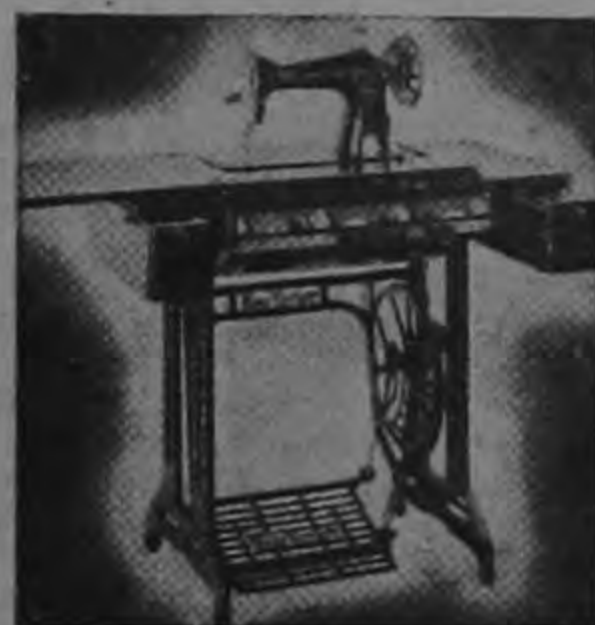
"MAQUINA 'NEW YORKER' A PEDAL DE 3 GAVETAS

W. J. HINE & Co. LTDA. APARTADO 1767 — SAN JOSE