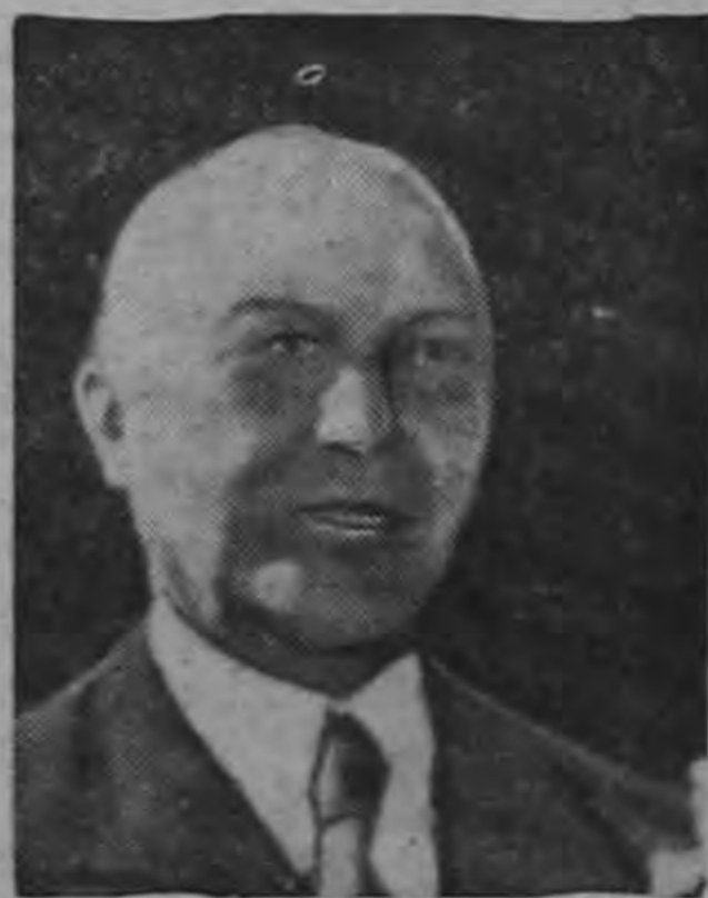
EL CANCELLER KONRAD ADENAUER, en los momentos en que pronunciaba su discurso en el Palacio Schaumburg, en Bonn, después de su resonante victoria en las elecciones alemanas.