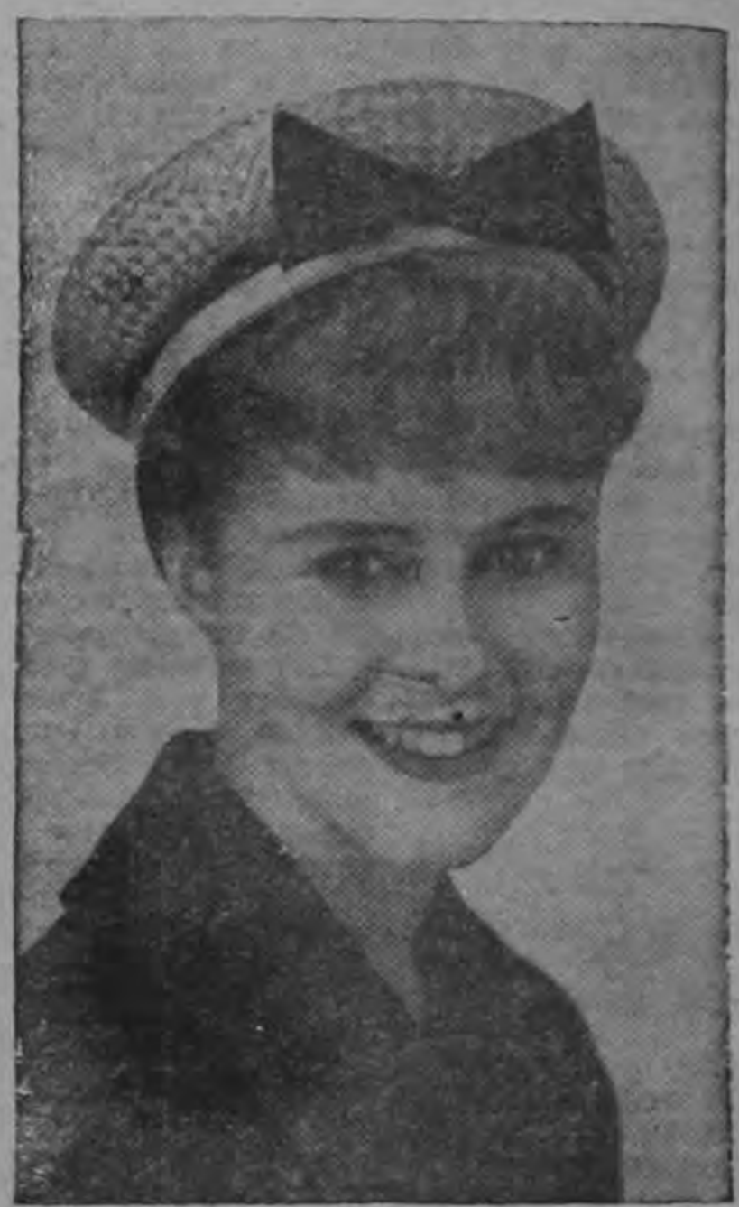
Una paja brillante, en color natural, se presta admirablemente para este elegante modelo tipo bretón.

Lindos sombreros para jovencitas seguramente los convertirán en los predilectos del elemento juvenil. Hay un aire alegre y elegante en estos lindos sombreritos, que