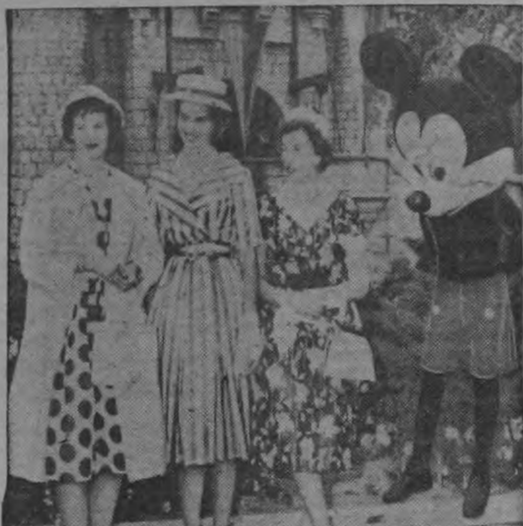
LA REALEZA VISITA DISNEYLANDIA —Incluso hasta el famoso ratón Miquito se sentirá orgulloso por la presencia de tres princesas escandinavas frente al Castillo de Disneylandia, en Anaheim, California. Los visitantes reales son, de izq. a derecha: La Princesa Margrethe de Dinamarca, la Princesa Margaretha de Suecia, y la Princesa Astrid, de Noruega.