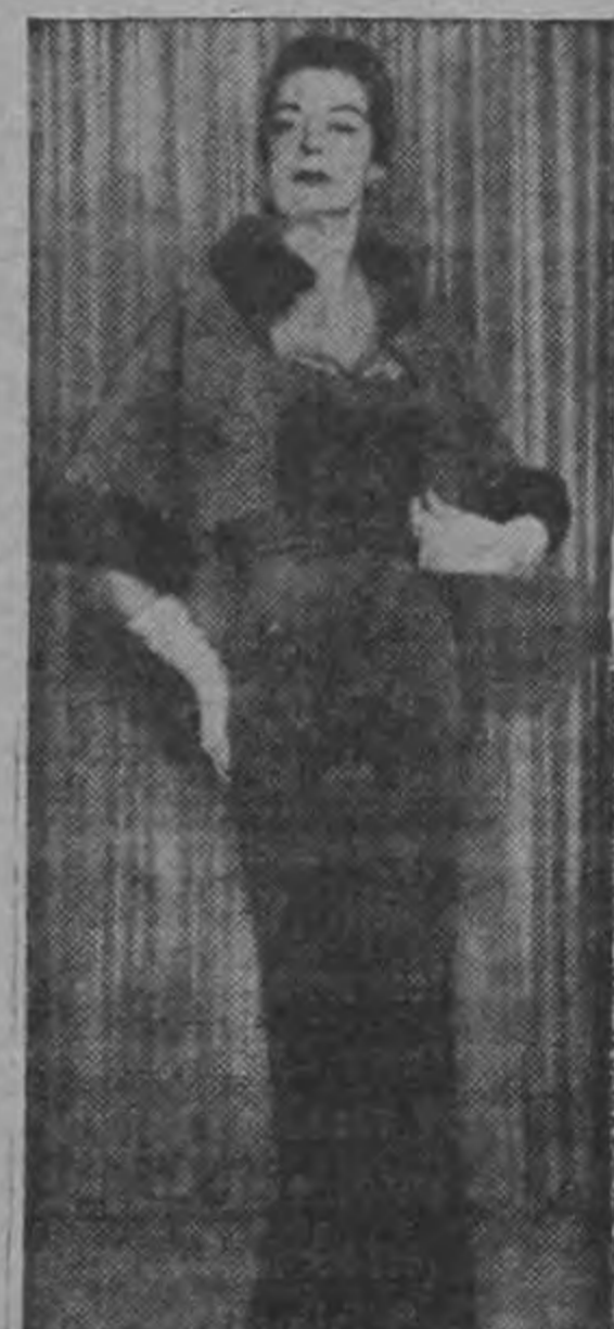
MODAS. — Este vestido de tafetán verde con chaqueta roja presenta la última palabra en modas para el otoño. Exhibido en Nueva York, la combinación tiene un costo de 895 dólares. La chaqueta, que llega hasta la cintura, tiene un cuello de piel de visón y mangas.

El domingo 12 será la rifa del aspirador eléctrico que ha venido haciendo el Garden Club de Cartago. Si el número premiado no ha sido vendido se repetirá la rifa.