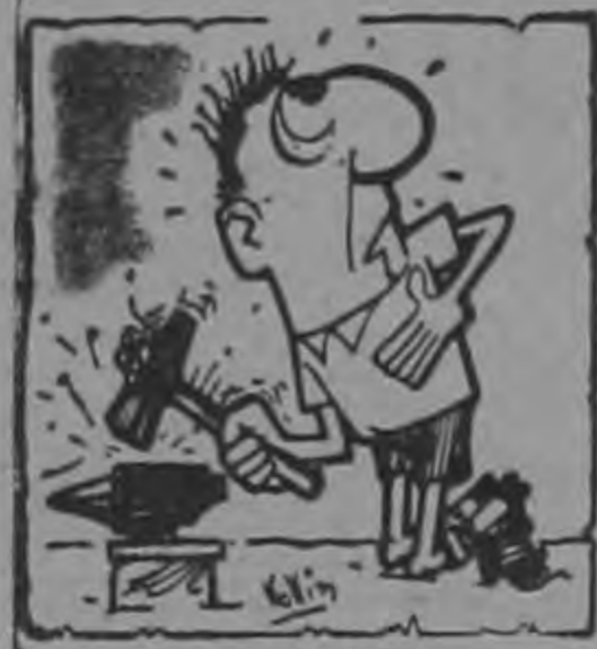
Por DON CANDIDO

Los hay tozudos. Nuestro Redactor nocturno se cerró en banda y no hay forma de convencerle de que vuelva a sus labores de "entre bastidores" — como él decía — para darnos a conocer todo lo que sucede en la casa grande del fútbol, en esas noches borrascosas del crudo invierno.