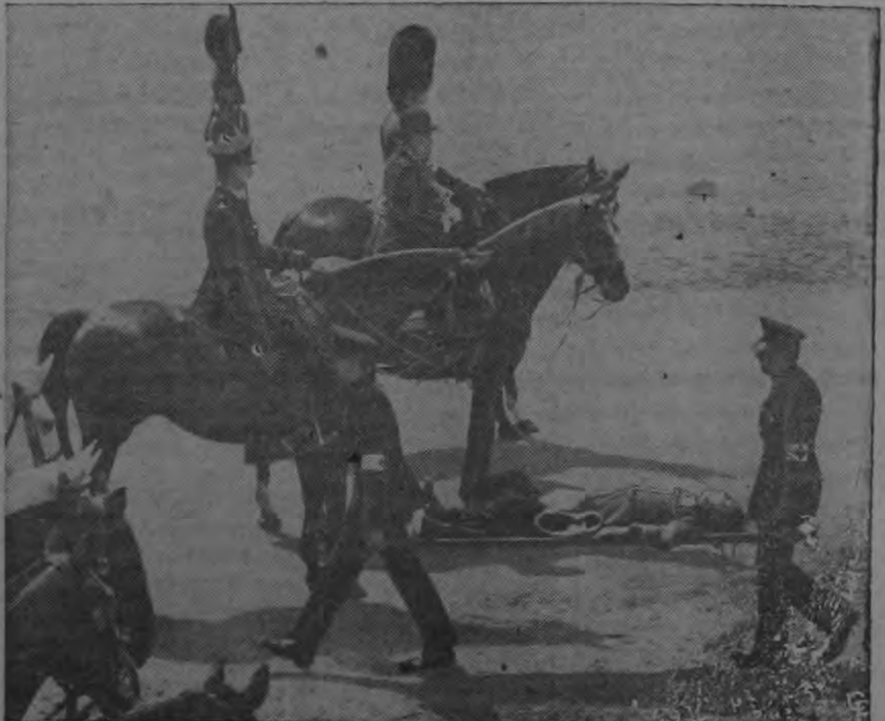
SE DESMAYA.— Un músico inconsciente es cargado en una camilla pasando frente al Iguazú de Gloucester, quien permanece erecto (izq.) sobre su montura, en Londres. El músico se desmayó durante un ensayo de las tropas para el cumpleaños oficial de la Reina Isabel II. El salar y la vaticinada contribuyeron para que varios miembros de la tropa perdieran el conocimiento. Si uno de ellos se desmaya durante la ceremonia, deberá permanecer en el suelo hasta que la rubana termine.

El avión de Frondizi deberá llegar a las 19:00 (17:00 est.) del lunes, y deberá viajar a Dakar a las 22:00 (20:00 est.)