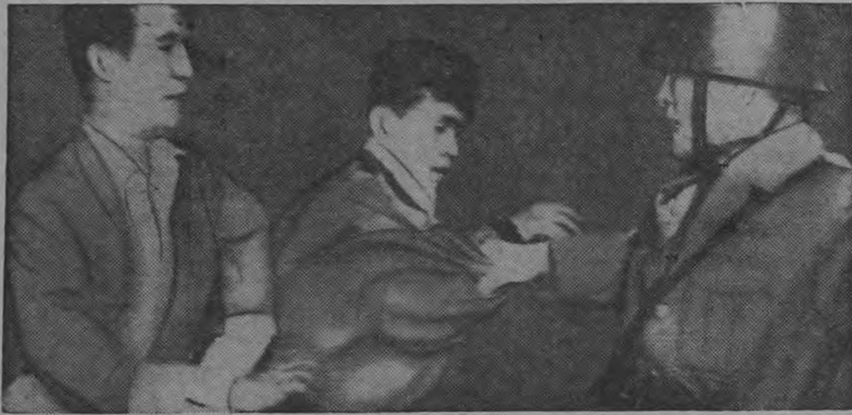
POLICIAS Y ESTUDIANTES CHOCAN EN TOKIO.—Más de 2 mil estudiantes izquierdistas, en una demostración contra el tratado de seguridad entre Estados Unidos y Japón, irrumpieron en la residencia del Premier Kishi, en Tokio. Una fuerza aproximada de 500 policías repelleron el ataque dejando 50 heridos entre policías y estudiantes. En la foto, un policía con casco de acero usa sus pies y manos durante la batalla con los estudiantes.