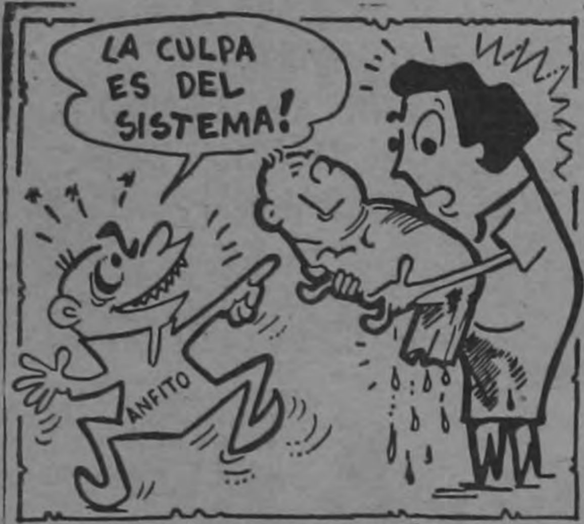
COSAS DE "ANFITO"