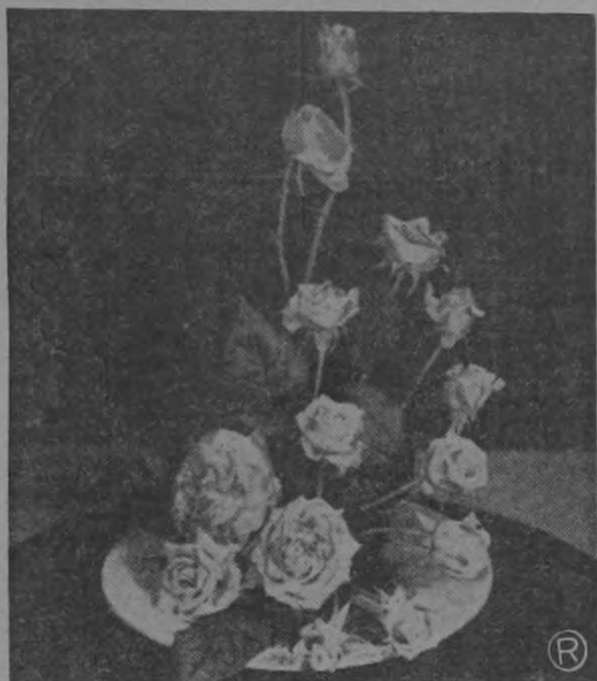
Los Estilos: Tradicional, Oriental y Moderno.