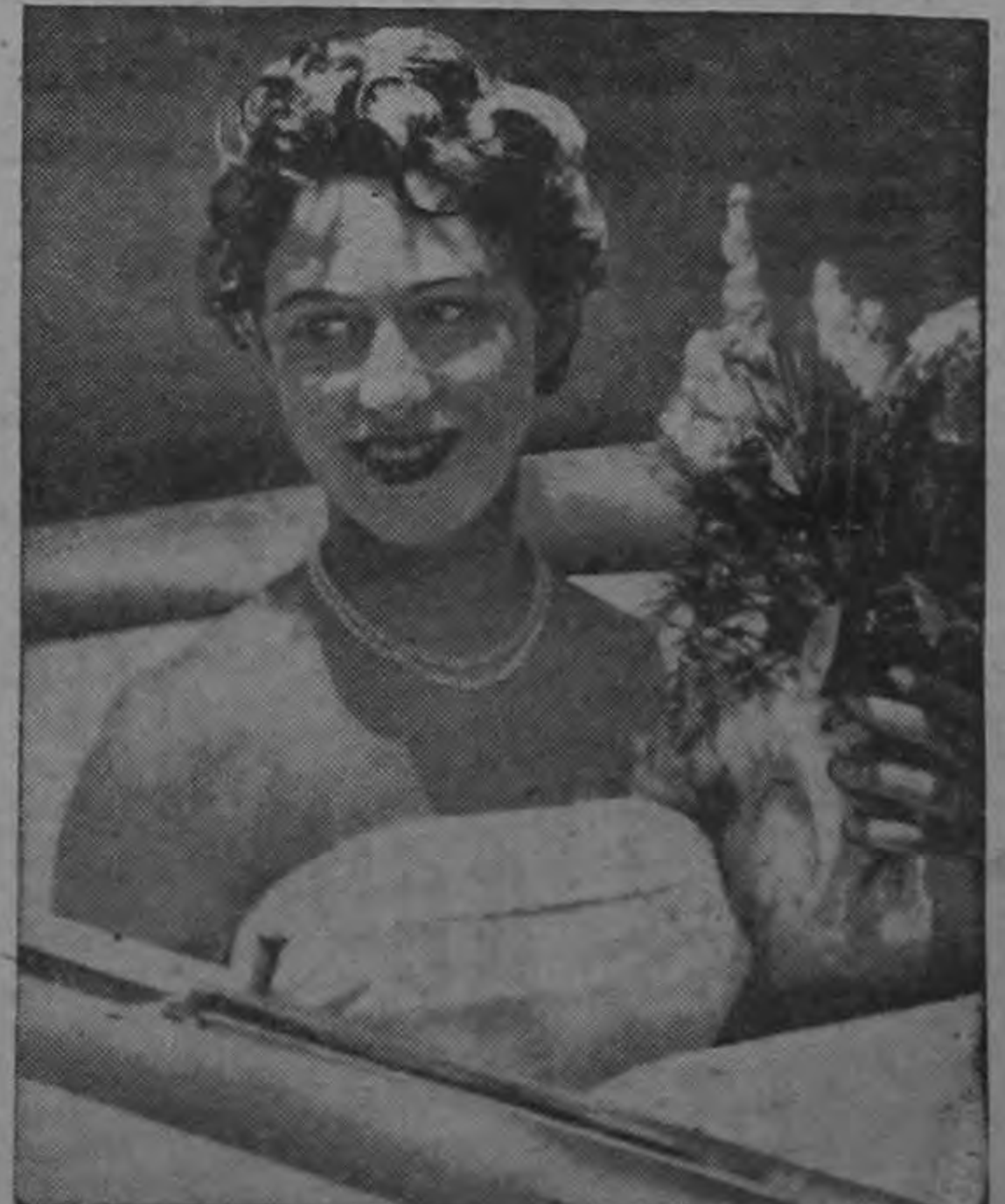
MARGARITA EN LAS INDIAS OCCIDENTALES —La F. de la sa Margarita de Gran Bretaña es todo sonrisa en compañía de su plebeyo esposo, Antony Armstrong-Jones, mientras recorren la Isla Dominica, en las Indias Occidentales. La pareja hizo escala en algunas islas durante su luna de miel por el Caribe a bordo del yate "Britannia".

Mientras de la política el Gobierno No extirpe el abejon; Mientras haya un Gobierno irresponsable, Habrá emisión.