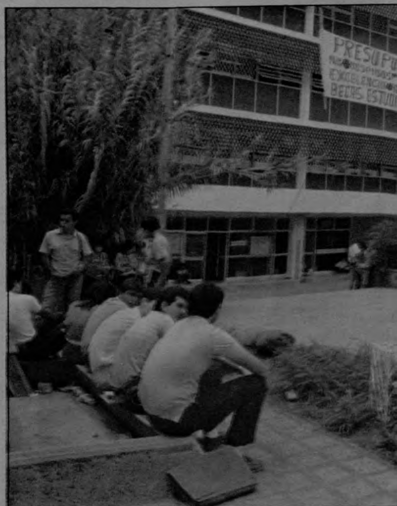
La Universidad de Costa Rica otorgará un certificado de reconocimiento a los estudiantes que cursen su carrera por medio de una "Beca Clyde J. Surgi".