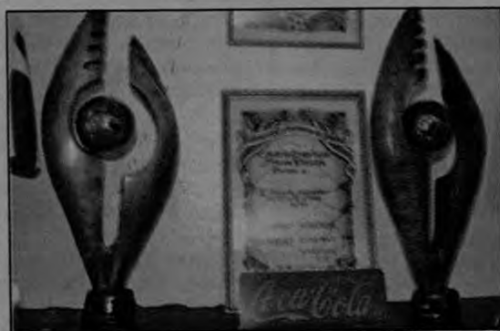
Las esculturas para el campeón y subcampeón fueron talladas por el artista nacional Herbert Zamora.

Los miembros de dicho tribunal aclararon que la decisión se tomó de acuerdo con el seguimiento que se le dio