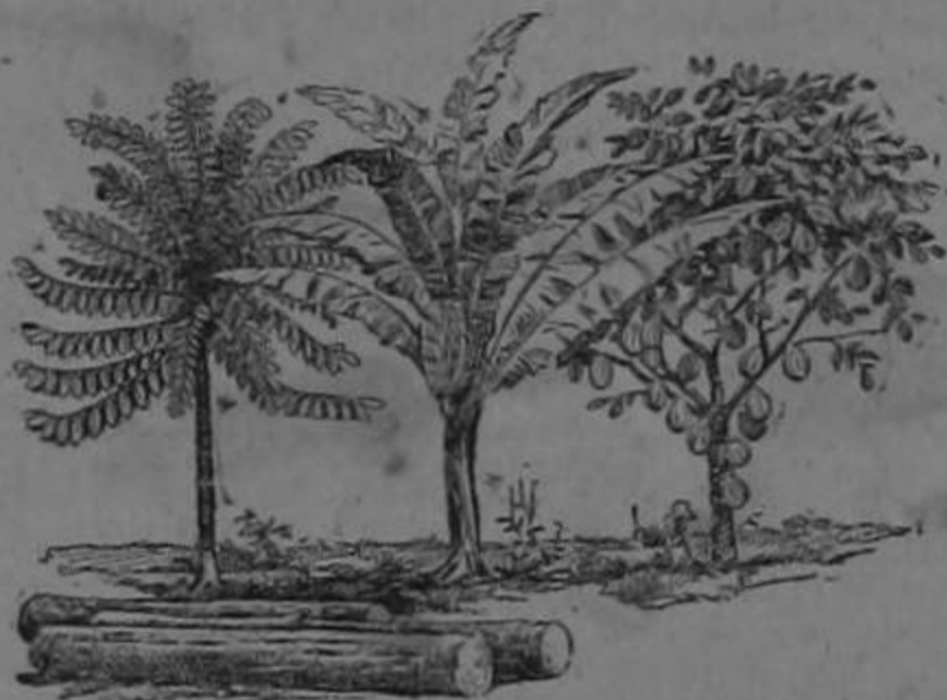
Rubber banana cacao