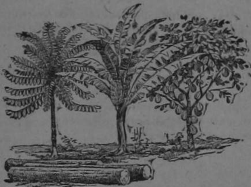
Rubber banana cacao