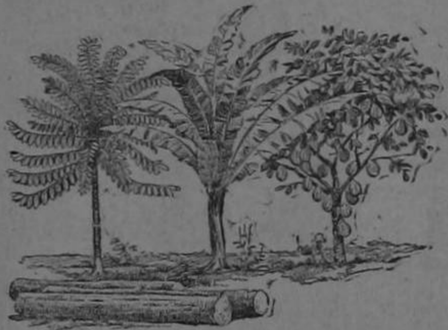
Rubber banana cacao

San José.—Calle Central Norte Número 117.