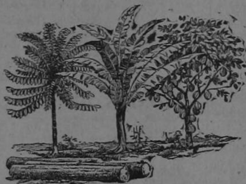
rubber banana cacao

San José.—Calle Central Norte Número 117.