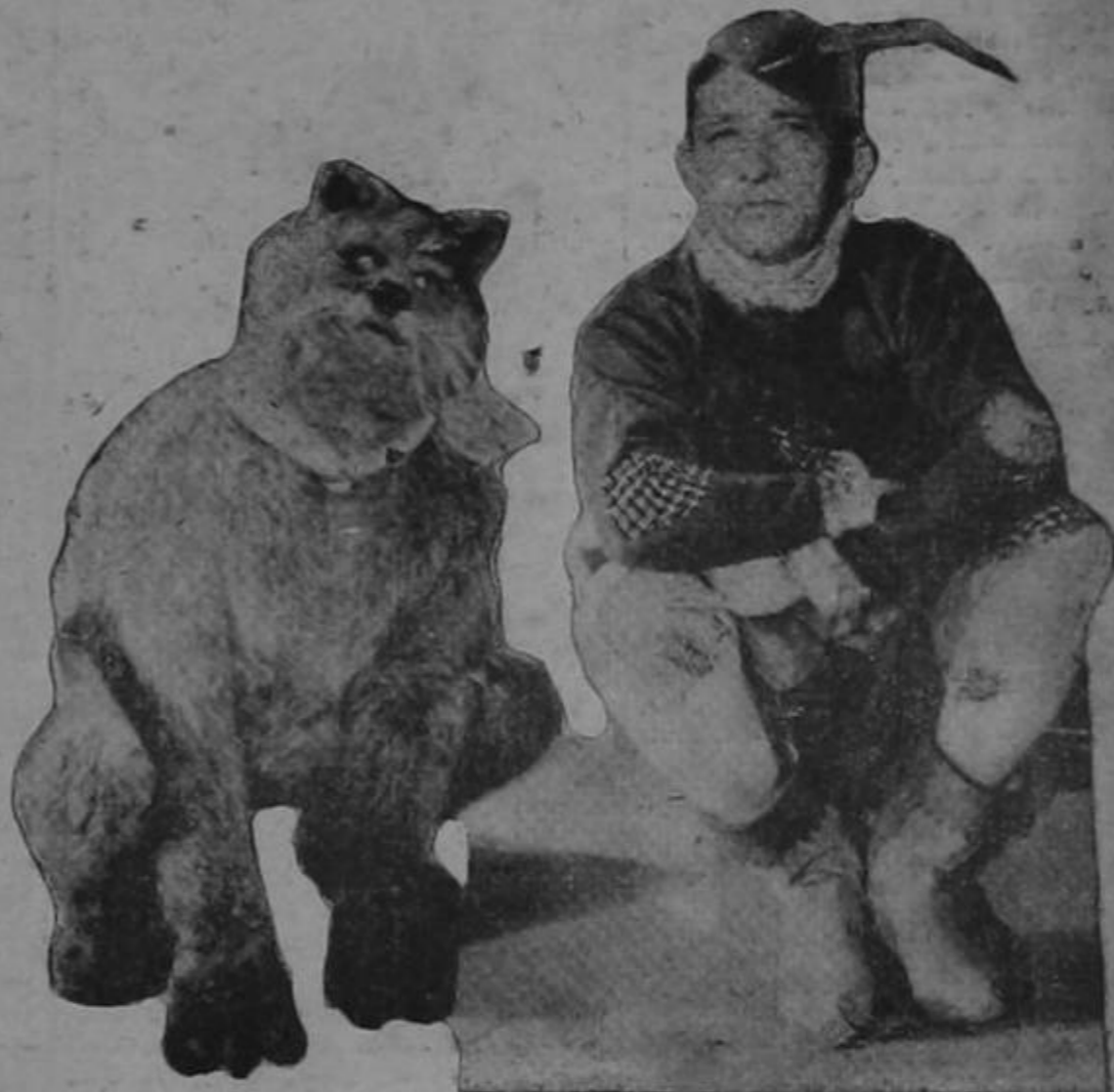
El Excmo. señor Embajador de Gatinlandia don Minino Miau y el requetetiranazo de don León Cortes Castro, posando especial y exclusivamente para LA SEMANA COMICA.