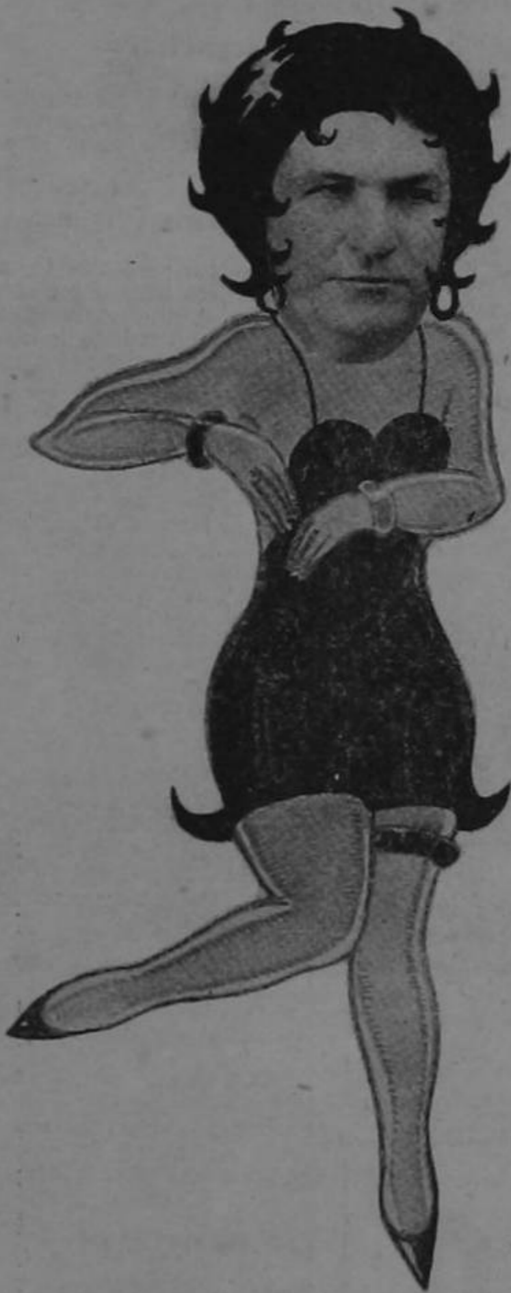
Dibujo de D. CLAUDIO CORTES